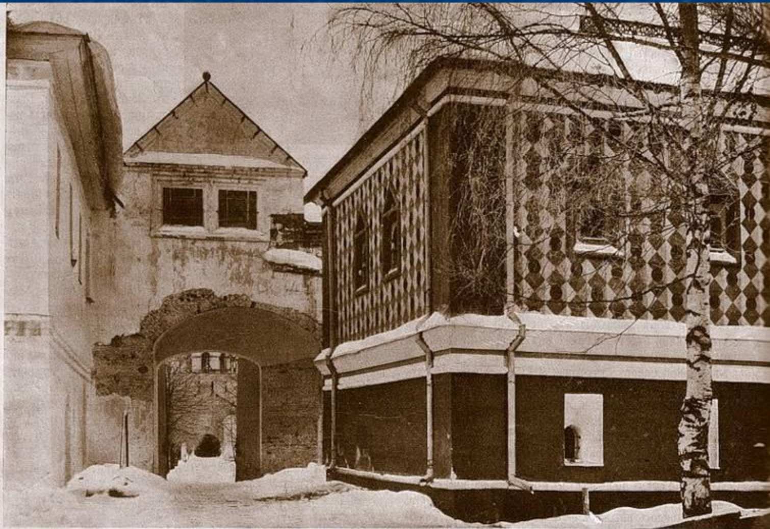
Городъ Кострома. Святыя Ворота у Палать царя Михаила Ѳеодоровича. Отсюда провожали перваго царя на царствованіе въ Москву.