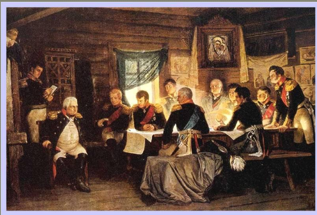
Военный совет в Филлях (1.9.1812)

Александр I и придворные требовали, чтобы под Москвой Кутузов дал сражение. Кутузов подойдя к Москве, собрал военный совет в д.Фили и выслушав всех присутствующих заявил: «С потерей Москвы - не потеряна еще Россия...Но, когда уничтожится армия погибнет Москва и Россия».