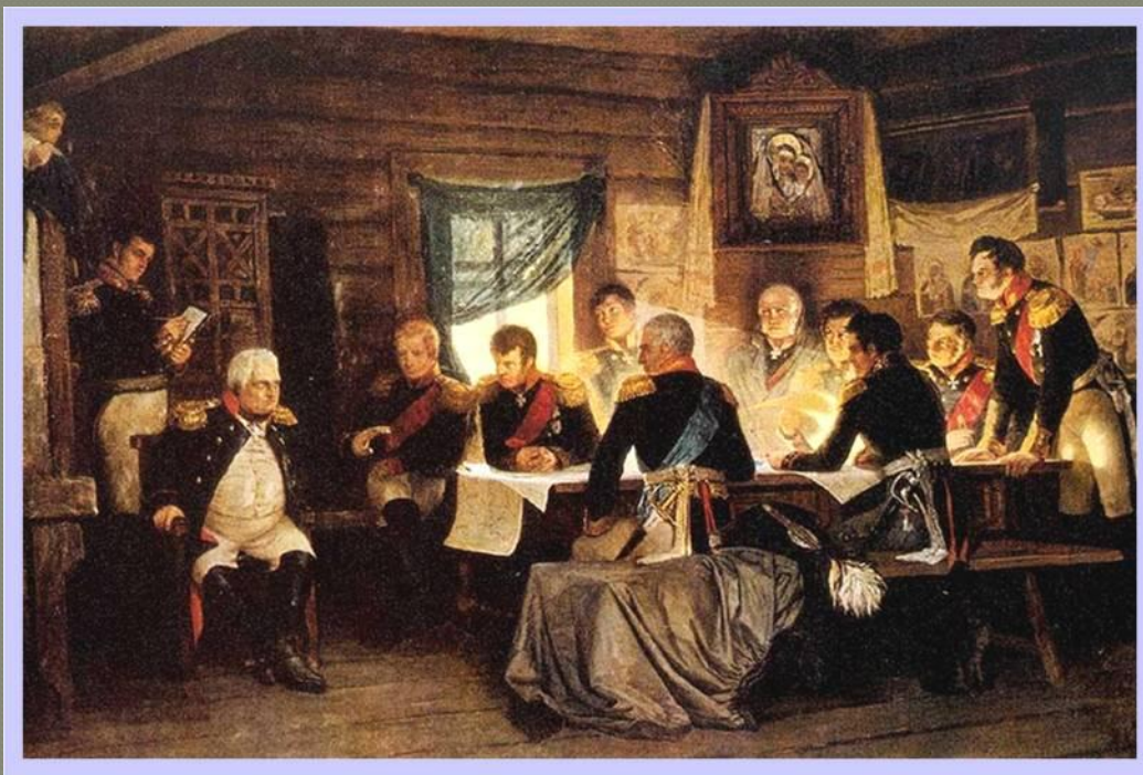
Военный совет в Филлях (1.9.1812)

Александр I и придворные требовали, чтобы под Москвой Кутузов дал сражение. Кутузов подойдя к Москве, собрал военный совет в д.Фили и выслушав всех присутствующих заявил: «С потерей Москвы - не потеряна еще Россия...Но, когда уничтожится армия погибнет Москва и Россия».