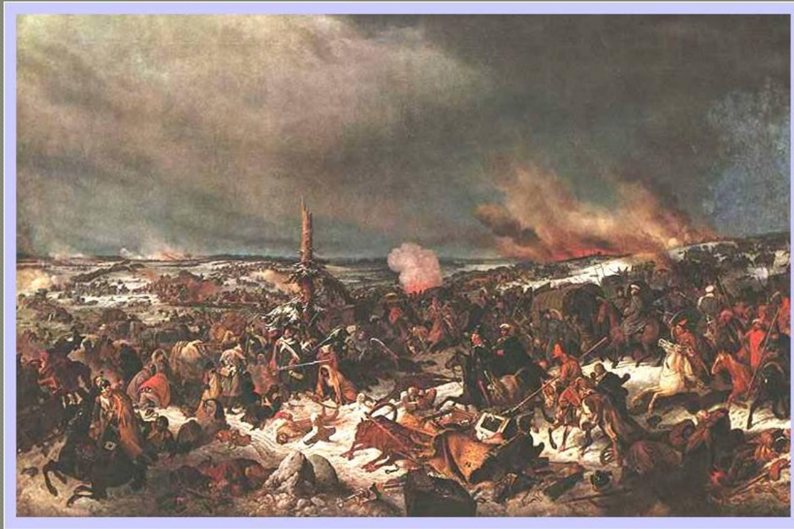
Переправа через р.Березину.

Последнее сражение разыгралось при переправе через р.Березину в ноябре 1812 года. Русские с ходу атаковали французов и Наполеон, потерявший здесь еще 30 000 солдат, бросил армию и с остатками Старой гвардии возвратился в Париж.