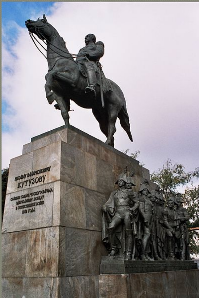
Памятник Кутузову в Москве. Скульптор — Н. В. Томский