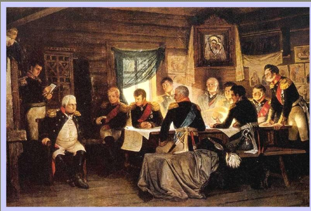
Военный совет в Филлах (1.9.1812)

Александр I и придворные требовали, чтобы под Москвой Кутузов дал сражение. Кутузов подойдя к Москве, собрал военный совет в д.Фили и выслушав всех присутствующих заявил: «С потерей Москвы - не потеряна еще Россия...Но, когда уничтожится армия погибнет Москва и Россия».