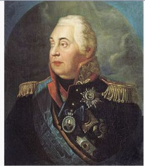
Портрет М. И. Кутузова кисти Р. М. Волкова