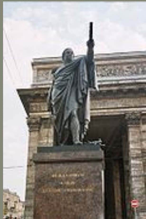
Памятник Кутузову в С.- Петербурге. Скульптор — Б. И. Орловский, литьё — В. П. Екимов, архитектор — К. А. Тон