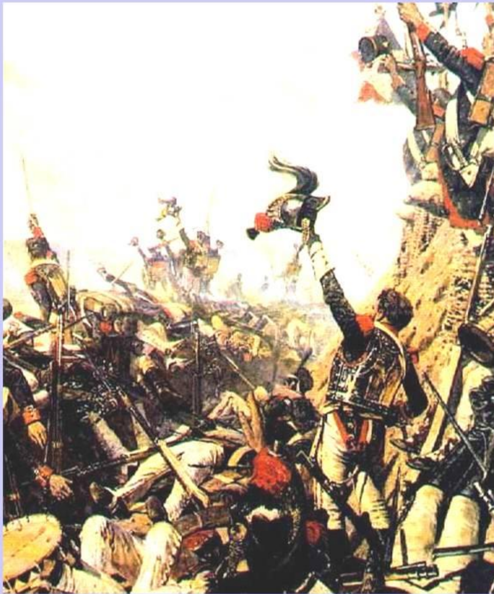
В.Верещагин. Конец Бородинского сражения