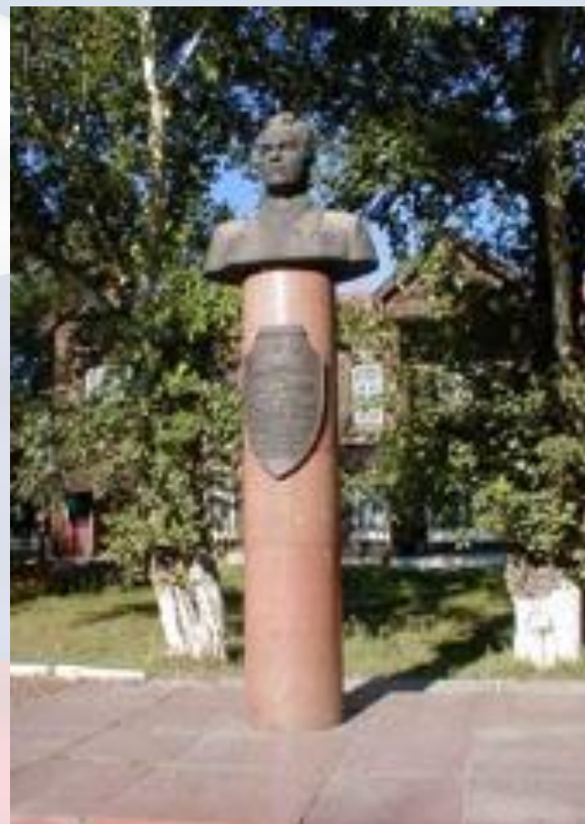
Бюст Калашникова в с.Курья Алтайского края