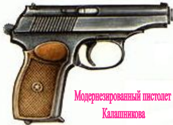
Модернизированный пистолет Калашникова