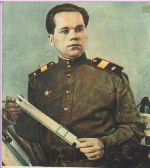
★ Советский воин №11 1949