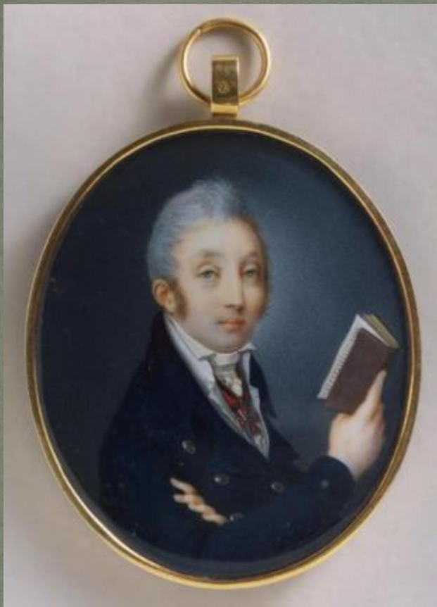
Михаил Михайлович Сперанский

Особое значение среди них имели два проекта, утвержденные императором: «Учреждения для управления Сибирских губерний» и «Устав об управлении инородцев». Особенностью явилось предложенное Сперанским новое деление коренного населения Сибири по образу жизни на оседлое, кочевое и бродячее. В период работы Батеньков искренне верил, что Сперанский, «вельможа добрый и сильный» действительно преобразит Сибирь. Впоследствии ему стало ясно, что Сперанскому не было дано «никаких средств к исполнению возложенного поручения». Однако Батеньков считал, что «за неуспех нельзя винить лично Сперанского». В конце января 1820 года Сперанский направил императору Александру краткий отчет о своей деятельности, где заявил, что сможет окончить все дела к маю месяцу, после чего пребывание его в Сибири «не будет иметь цели». Император предписывал своему бывшему госсекретарю расположить путь из Сибири таким образом, чтобы прибыть в столицу к последним числам марта будущего года. Эта отсрочка сильно повлияла на Сперанского. В его душе начали преобладать чувство бессмысленности собственной деятельности. Однако недолго Сперанский пребывал в отчаянии и в марте 1821 года вернулся в столицу.