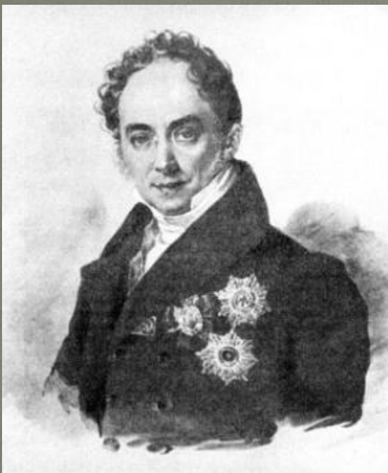
В. П. Кочубей

Летом 1801 г. В. П. Кочубей взял Сперанского в свою «команду». В это время в «Негласном комитете» шла работа по разработке министерской реформы. Указом от 8 сентября 1802 г. в России учреждались восемь министерств. Министры имели право личного доклада императору. В. П. Кочубей возглавил Министерство внутренних дел. Он по достоинству оценил способности Сперанского и уговорил Александра I, чтобы тот позволил Михаилу Михайловичу работать под его руководством, статс-секретарём. В 1802—1804 годах Сперанский подготовил несколько собственных политических записок: «О коренных законах государства», «О постепенности усовершенствования общественного», «О силе общественного мнения», «Ещё нечто о свободе и рабстве», «Записку об устройстве судебных и правительственных учреждений в России». В этих документах он впервые изложил свои взгляды на состояние государственного аппарата России и обосновал необходимость реформ в стране. В июне 1802 г, в возрасте тридцати лет, Сперанский возглавил в Министерстве внутренних дел отдел, которому предписывалось готовить проекты государственных преобразований.