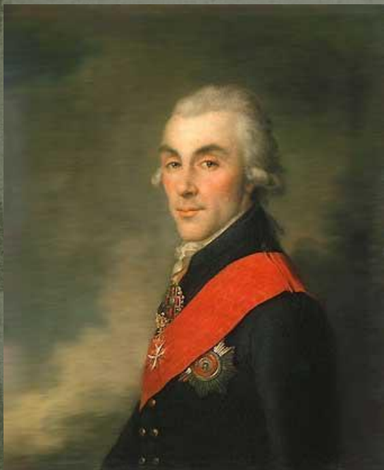
Аракчеев А. А.

Отправляясь в ссылку, он не знал, какой приговор вынесен ему в Зимнем дворце. Отношение в простом народе к Сперанскому было противоречивое, как отмечает М. А. Корф: «...местами ходил, довольно громкий говор, что государев любимец был оклеветан, и многие помещичьи крестьяне даже отправляли за него задравные молебны и ставили свечи. Дослужась, — говорили они, — из грязи до больших чинов и должностей и быв умом выше всех между советниками царскими, он стал за крепостных..., возмутив против себя всех господ, которые за это, а не за предательство какое-нибудь, решились его погубить». Тем не менее, обвинение в измене не списывалось со счетов. В 1814 г. Сперанскому было разрешено проживание под полицейским надзором в своем небольшом имении Великополье Новгородской губернии. Здесь он встречался с Аракчеевым А. А. и через него ходатайствовал перед Александром I о своем полном «прощении». М. М. Сперанский неоднократно обращался к императору и министру полиции с просьбой разъяснить его положение и оградить от оскорблений. Эти обращения возымели последствия: распоряжением Александра надлежало выплатить Сперанскому по 6 тысяч рублей в год с момента высылки. Данный документ начинался словами: «Пребывающему в Перми тайному советнику Сперанскому...». Кроме того, распоряжение было свидетельством, что император Сперанского не забывает и ценит.