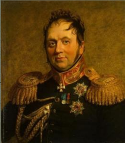
Шведский барон Густав Армфельд

Сговорившись между собой, участники интриги стали с некоторых пор регулярно сообщать государю разные дерзкие отзывы, исходящие из уст его госсекретаря. Но Александр не стремился прислушиваться, так как в отношениях с Францией были проблемы, а предостережения Сперанского о неизбежности войны, его настойчивые призывы готовиться к ней, конкретные и разумные советы не давали оснований для сомнений в преданности его России. В день своего 40-летия Сперанский был удостоен орденом Александра Невского. Однако ритуал вручения прошёл непривычно строго, и стало ясно, что «звезда» реформатора начинает тускнеть. Недоброжелатели (среди которых был Шведский барон Густав Армфельд, председатель комитета по делам Финляндии, и А. Д. Балашов, руководитель Министерства полиции.) Сперанского ещё больше активизировались. Они передавали Александру все сплетни и слухи о госсекретаре. Но возможно, эти отчаянные доносы в конечном счёте не возымели бы сильного действия на императора, если б весной 1811 г лагерь противников реформ не получил вдруг идейно-теоретического подкрепления. В Твери вокруг сестры Александра Екатерины Павловны сложился кружок людей недовольных либерализмом государя и в особенности деятельностью Сперанского.