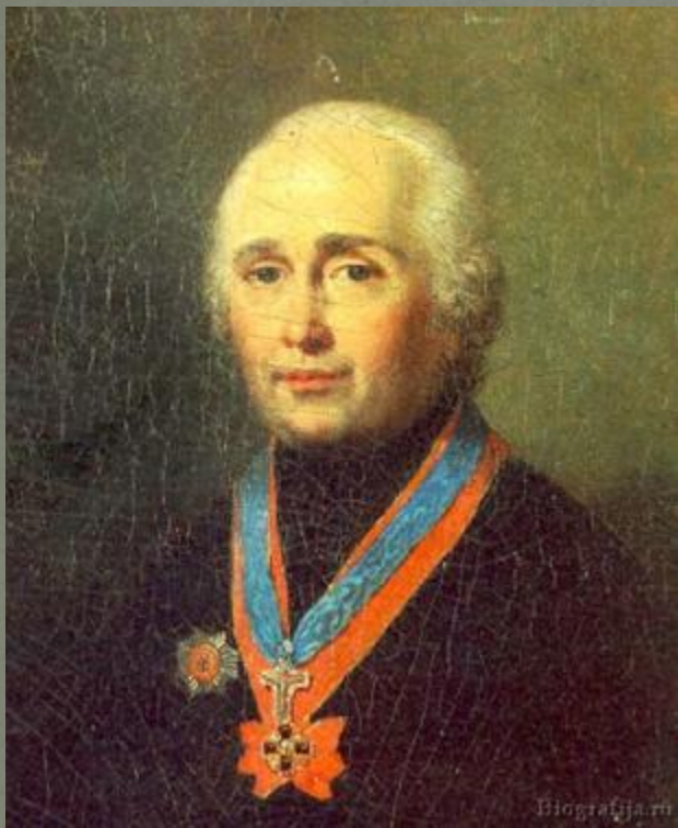
Андрей Афанасьевич Самборский

Мальчик регулярно ходил со своим слепым дедом в церковь и там из-за стойки читал Апостола и Часослов в церкви вместо пономаря. Сперанский впоследствии никогда не забывал о своем низком происхождении и гордился им. Мальчику было шесть лет, когда в его жизни произошло событие, оказавшее огромное влияние на дальнейшую жизнь: летом в Черкутино приехали владелец поместья Николай Иванович и протоиерей Андрей Афанасьевич Самборский, который был тогда гофмейстером двора наследника престола Павла Петровича, а позже (с 1784 года) стал духовником великих князей Александра и Константина Павловичей. Самборскому мальчик очень понравился, он познакомился с его родителями, играл с ним, носил на руках, в шутку приглашал в Петербург.