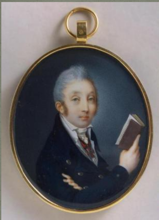
Михаил Михайлович Сперанский