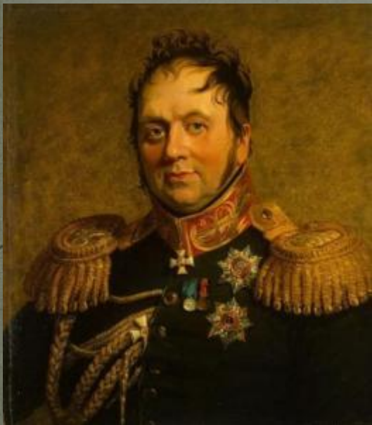
Шведский барон Густав Армфельд

Сговорившись между собой, участники интриги стали с некоторых пор регулярно сообщать государю разные дерзкие отзывы, исходящие из уст его госсекретаря. Но Александр не стремился прислушиваться, так как в отношениях с Францией были проблемы, а предостережения Сперанского о неизбежности войны, его настойчивые призывы готовиться к ней, конкретные и разумные советы не давали оснований для сомнений в преданности его России. В день своего 40-летия Сперанский был удостоен орденом Александра Невского. Однако ритуал вручения прошёл непривычно строго, и стало ясно, что «звезда» реформатора начинает тускнеть. Недоброжелатели (среди которых был Шведский барон Густав Армфельд, председатель комитета по делам Финляндии, и А. Д. Балашов, руководитель Министерства полиции.) Сперанского ещё больше активизировались. Они передавали Александру все сплетни и слухи о госсекретаре. Но возможно, эти отчаянные доносы в конечном счёте не возымели бы сильного действия на императора, если б весной 1811 г лагерь противников реформ не получил вдруг идейно-теоретического подкрепления. В Твери вокруг сестры Александра Екатерины Павловны сложился кружок людей недовольных либерализмом государя и в особенности деятельностью Сперанского.