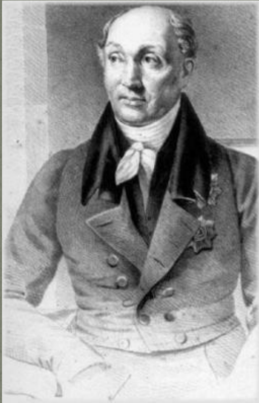
Михаил Михайлович Сперанский

В Александро-Невскую семинарию направлялись лучшие слушатели провинциальных семинарий со всей России. В их число удостоился чести попасть и Михаил Михайлович Сперанский, по направлению прибывший в столицу. Свободно овладев французским, он увлекся просветительской философией, что наложило несмываемый отпечаток на него в будущем. Выдающийся ум и независимость суждений проявляются в ученических проповедях Сперанского. Лучшему студенту (как и во Владимире — Сперанскому) священноначалие доверило произносить проповеди. 8 октября 1791 года он произнёс в Александро-Невской лавре необычайно смелое наставление в присутствии знаменитого митрополита Гавриила. Речь его содержала обращение к государю с предостережением и рассказывала об «истинном и ложном просвещении». Свои свободные часы, в отличие от большинства своих товарищей, Сперанский предпочитал проводить не в доступных развлечениях, а в чтении имеющихся книг. Это время в его жизни было периодом интенсивных движений ума, и окончательного духовного созревания. Все это позволило Сперанскому стать одним из наиболее эрудированных семинаристов.