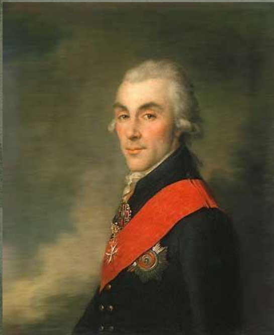
Аракчеев А. А.

Отправляясь в ссылку, он не знал, какой приговор вынесен ему в Зимнем дворце. Отношение в простом народе к Сперанскому было противоречивое, как отмечает М. А. Корф: «...местами ходил, довольно громкий говор, что государев любимец был оклеветан, и многие помещичьи крестьяне даже отправляли за него задравные молебны и ставили свечи. Дослужась, — говорили они, — из грязи до больших чинов и должностей и быв умом выше всех между советниками царскими, он стал за крепостных..., возмутив против себя всех господ, которые за это, а не за предательство какое-нибудь, решились его погубить». Тем не менее, обвинение в измене не списывалось со счетов. В 1814 г. Сперанскому было разрешено проживание под полицейским надзором в своем небольшом имении Великополье Новгородской губернии. Здесь он встречался с Аракчеевым А. А. и через него ходатайствовал перед Александром I о своем полном «прощении». М. М. Сперанский неоднократно обращался к императору и министру полиции с просьбой разъяснить его положение и оградить от оскорблений. Эти обращения возымели последствия: распоряжением Александра надлежало выплатить Сперанскому по 6 тысяч рублей в год с момента высылки. Данный документ начинался словами: «Пребывающему в Перми тайному советнику Сперанскому...». Кроме того, распоряжение было свидетельством, что император Сперанского не забывает и ценит.