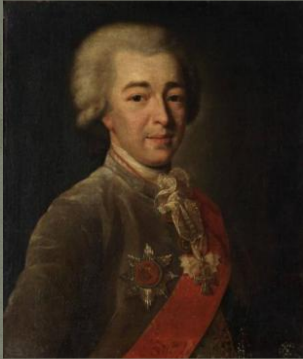
А. Б. Куракин