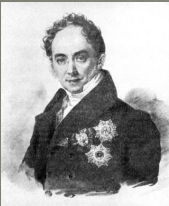
В. П. Кочубей

Летом 1801 г. В. П. Кочубей взял Сперанского в свою «команду». В это время в «Негласном комитете» шла работа по разработке министерской реформы. Указом от 8 сентября 1802 г. в России учреждались восемь министерств. Министры имели право личного доклада императору. В. П. Кочубей возглавил Министерство внутренних дел. Он по достоинству оценил способности Сперанского и уговорил Александра I, чтобы тот позволил Михаилу Михайловичу работать под его руководством, статс-секретарём. В 1802—1804 годах Сперанский подготовил несколько собственных политических записок: «О коренных законах государства», «О постепенности усовершенствования общественного», «О силе общественного мнения», «Ещё нечто о свободе и рабстве», «Записку об устройстве судебных и правительственных учреждений в России». В этих документах он впервые изложил свои взгляды на состояние государственного аппарата России и обосновал необходимость реформ в стране. В июне 1802 г, в возрасте тридцати лет, Сперанский возглавил в Министерстве внутренних дел отдел, которому предписывалось готовить проекты государственных преобразований.