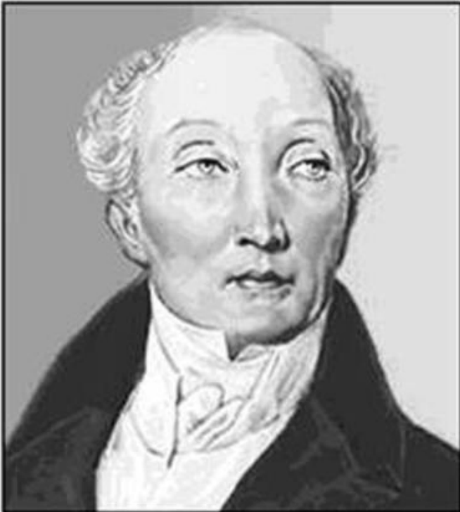
Михаил Михайлович Сперанский

Реформы, проводимые Сперанским, затронули практически все слои российского общества. Это вызвало бурю недовольных возгласов со стороны дворянства и чиновничества, чьи интересы были затронуты более всего. Всё это отрицательно сказалось на положении самого государственного советника. Просьбу об отставке в феврале 1811 г. Александр I не удовлетворил, и Сперанский продолжил работу. Но дальнейшее течение дел и времени приносило ему все новых и новых недоброжелателей. В последнем случае Михаилу Михайловичу припомнили Эрфурт и встречи с Наполеоном. Этот упрек в условиях обострившихся российско-французских отношений было особенно тяжелым. Интрига всегда играет большую роль там, где существует режим личной власти. К самолюбию прибавлялась в Александре чрезвычайная боязнь насмешки над собой. Если кто-либо засмеется его присутствию, на него посматривая, Александр тут же начинал думать, что это над ним смеются. В случае со Сперанским противники реформ выполнили такую задачу блестяще.