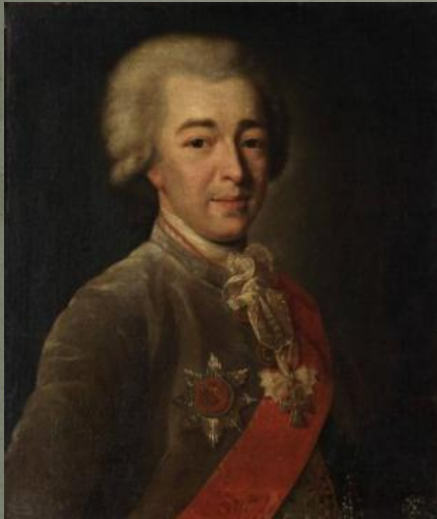
А. Б. Куракин