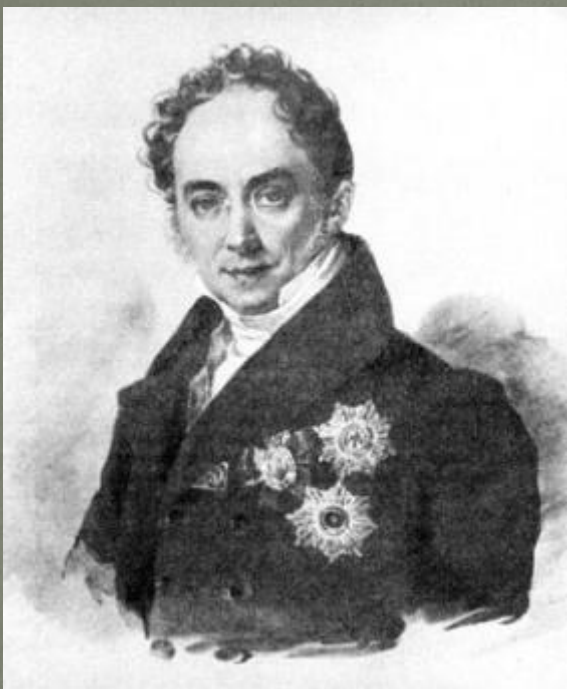
В. П. Кочубей

Летом 1801 г. В. П. Кочубей взял Сперанского в свою «команду». В это время в «Негласном комитете» шла работа по разработке министерской реформы. Указом от 8 сентября 1802 г. в России учреждались восемь министерств. Министры имели право личного доклада императору. В. П. Кочубей возглавил Министерство внутренних дел. Он по достоинству оценил способности Сперанского и уговорил Александра I, чтобы тот позволил Михаилу Михайловичу работать под его руководством, статс-секретарём. В 1802—1804 годах Сперанский подготовил несколько собственных политических записок: «О коренных законах государства», «О постепенности усовершенствования общественного», «О силе общественного мнения», «Ещё нечто о свободе и рабстве», «Записку об устройстве судебных и правительственных учреждений в России». В этих документах он впервые изложил свои взгляды на состояние государственного аппарата России и обосновал необходимость реформ в стране. В июне 1802 г, в возрасте тридцати лет, Сперанский возглавил в Министерстве внутренних дел отдел, которому предписывалось готовить проекты государственных преобразований.