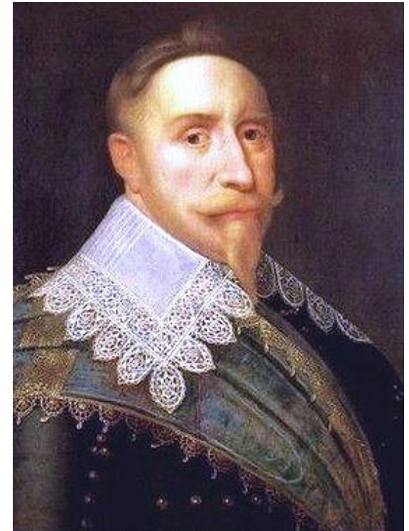
Густав II Адольф