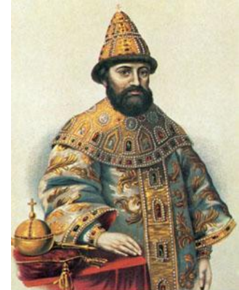
Михаил Федорович (1596-1645)