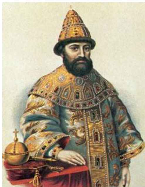
Михаил Федорович (1596-1645)