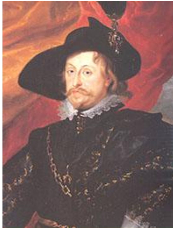
Владислав IV Ваза