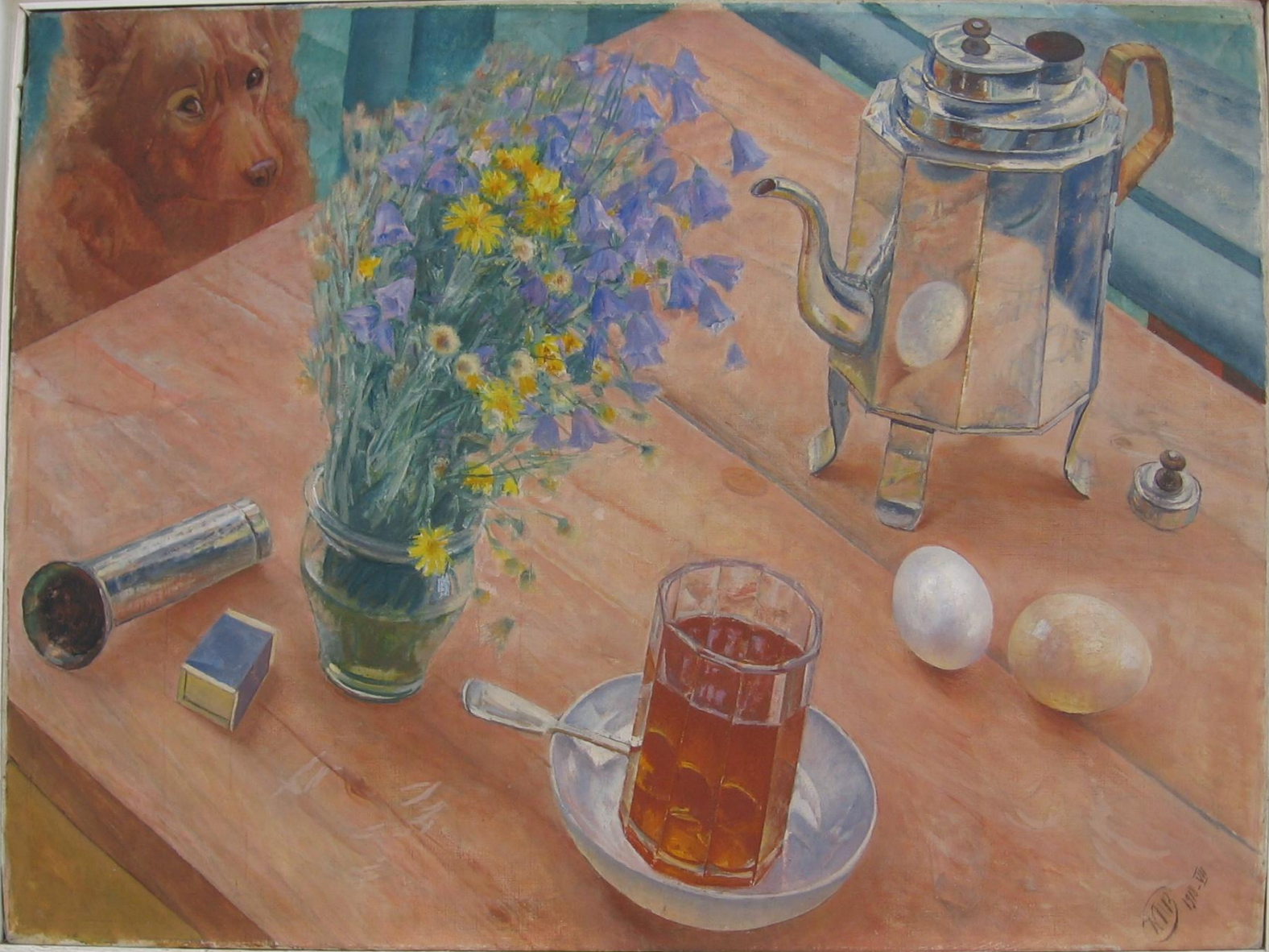
К. С. ПЕТРОВ ВОДКИН Kuzma PETROV-VODKIN Украиния Мюнхен ІнтермуДІУ.ІІІІ ШІІІ ІІІІ