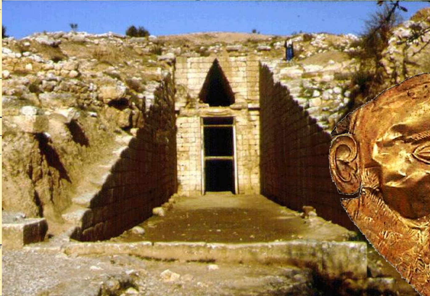
Гробница царя Агамемнона