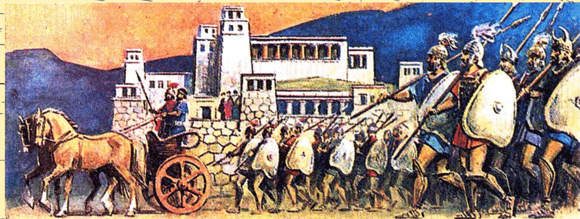
Выступление войска из древних Микен