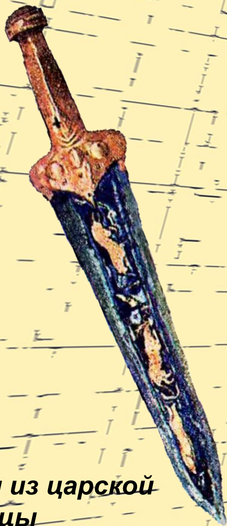
Кинжал из царской гробницы