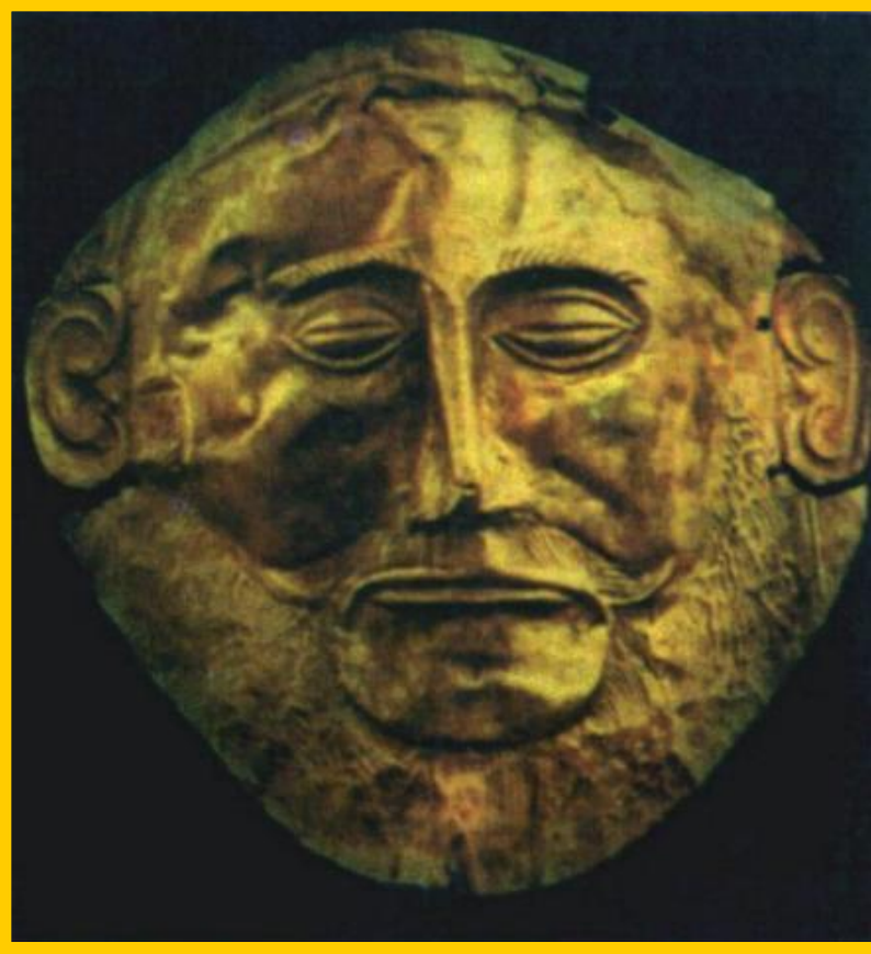
Золотая маска Агамемнона.

Предводителем Греков был царь Микен-Ага- мемнон.