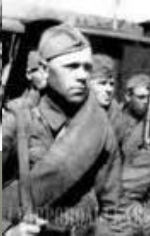
Советские воины отправляются на фронт