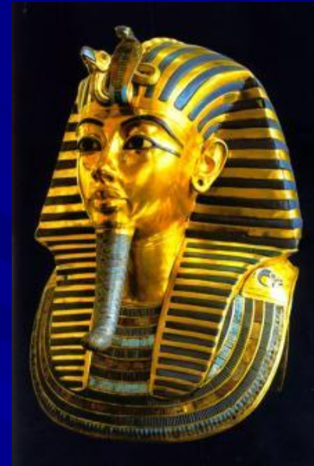
Золотой саркофаг Тутанхамона. Тутанхамон умер в возрасте 19 лет.