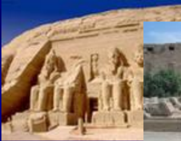
Храм Рамзеса, Абу – Симбел