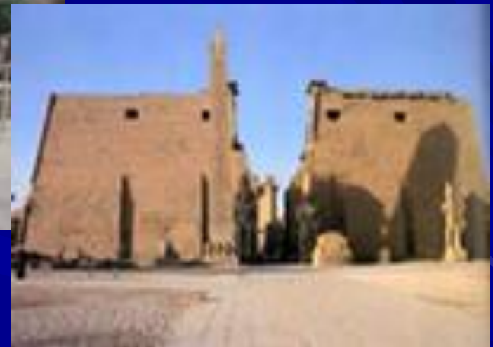
Храм бога Амона Ра в Луксоре