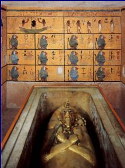
Погребальная камера с саркофагом Тутанхамона. Саркофаг – массивный гроб. Фараон – ц а р ь Египта