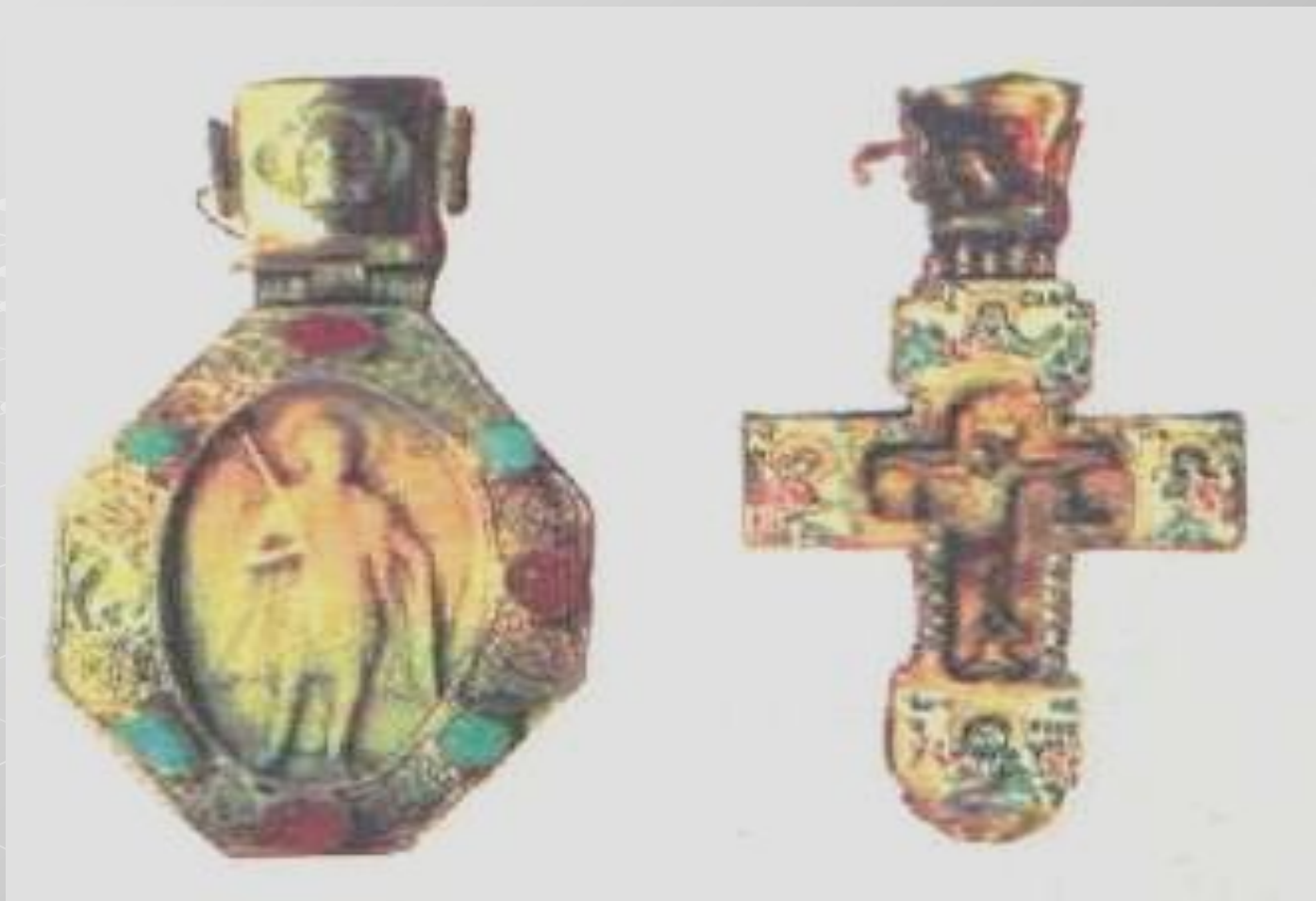
Изделия владимирских мастеров XVI – XVII вв.