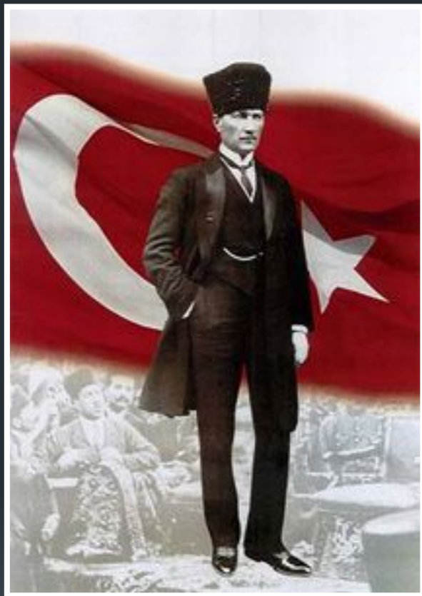
Мустафа Кемаль основатель и первый лидер Республиканской народной партии Турции