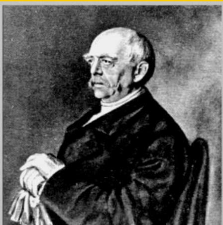
Отто фон Бисмарк