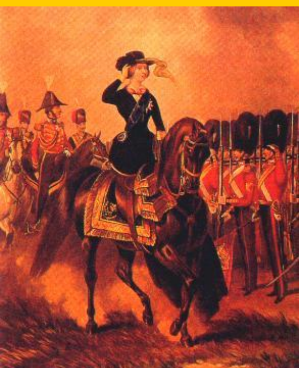
Английская королева Виктория.