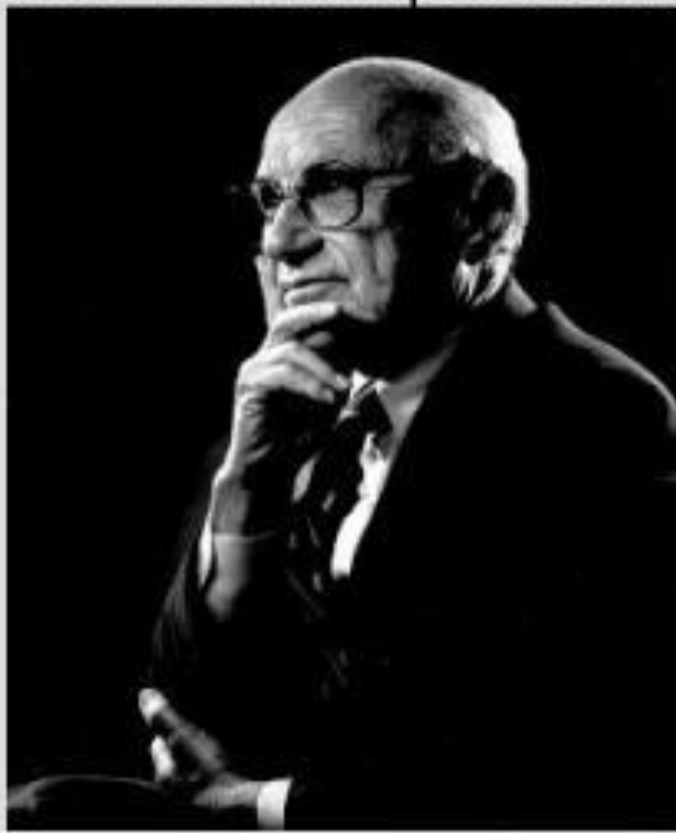
Идеолог монетаризма Милтон Фридман