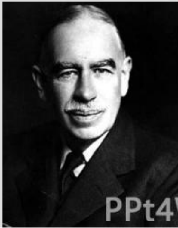
Основатель кейнсианства – Джон Кейнс