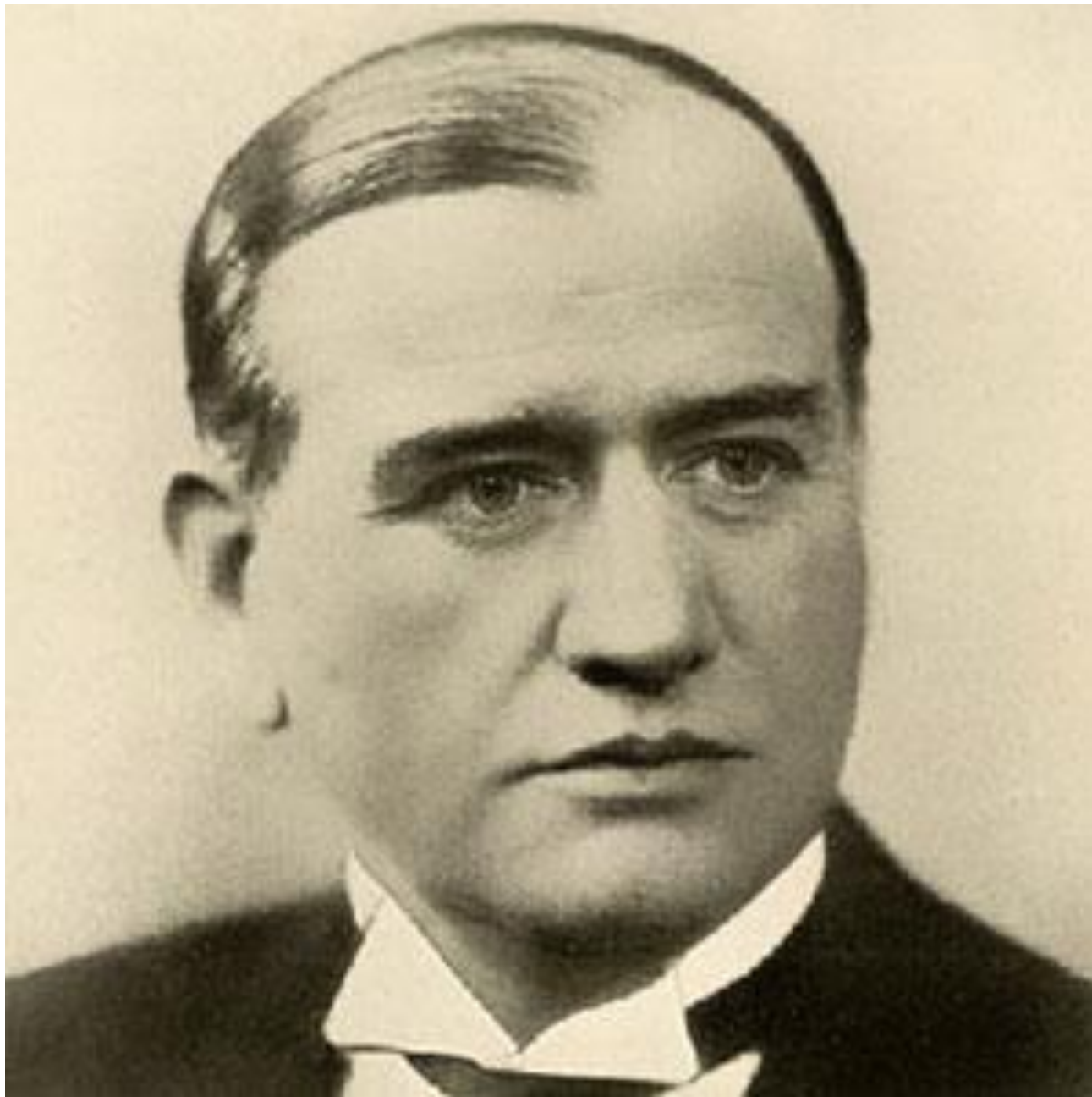
• Эдуард Даладые