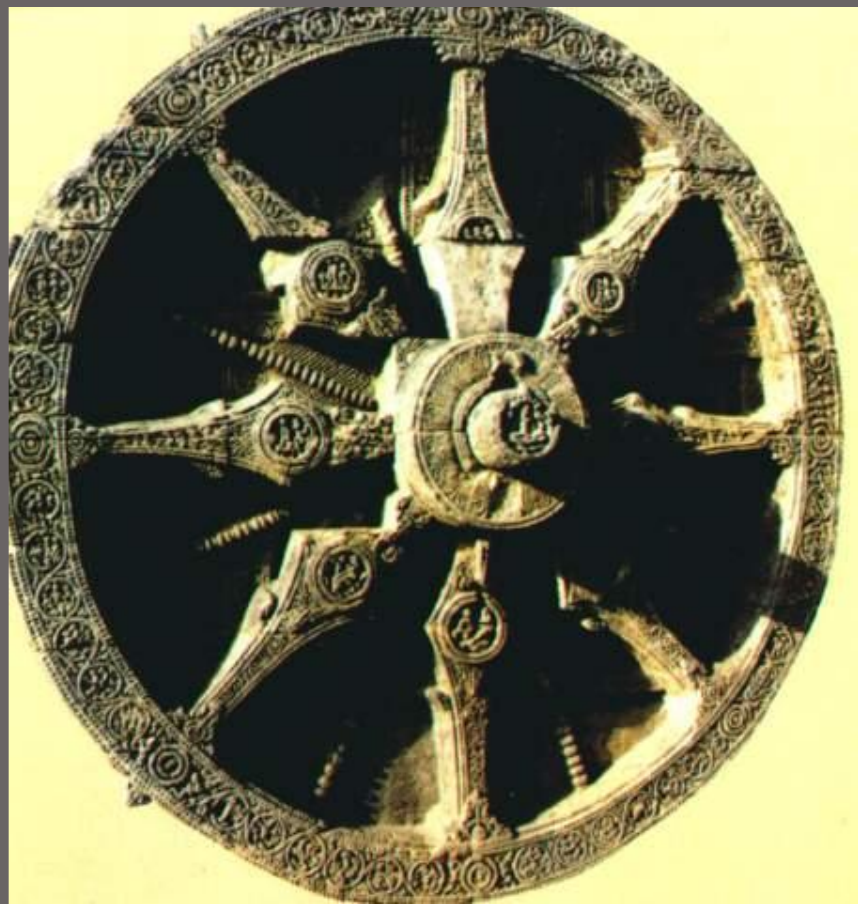
Колесо Солнца. Каменные часы.

С начала нашей эры в Индии использовалась десятичная система. Математики использовали дроби, вычисляли площадь и объем фигур.