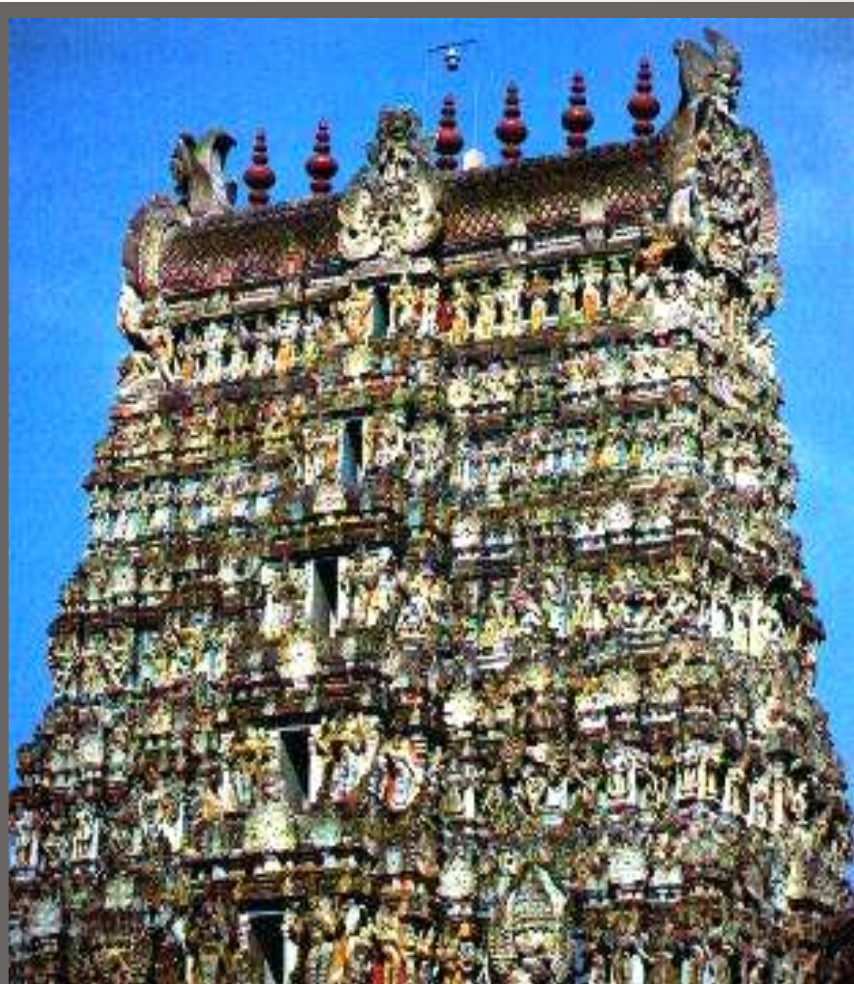
Ворота Райя в Мадурани.

Архитектура страны отличалась удивительным разнообразием. Сначала храмы высекались в скалах. Они возводились веками. Их стены расписывались фресками. С VII в. индуистские храмы стали возводиться в виде башен. Их стены покрывались