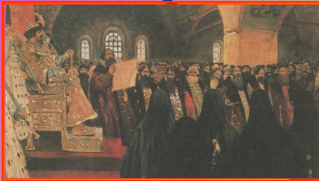
С.В. Иванов «Земский собор»