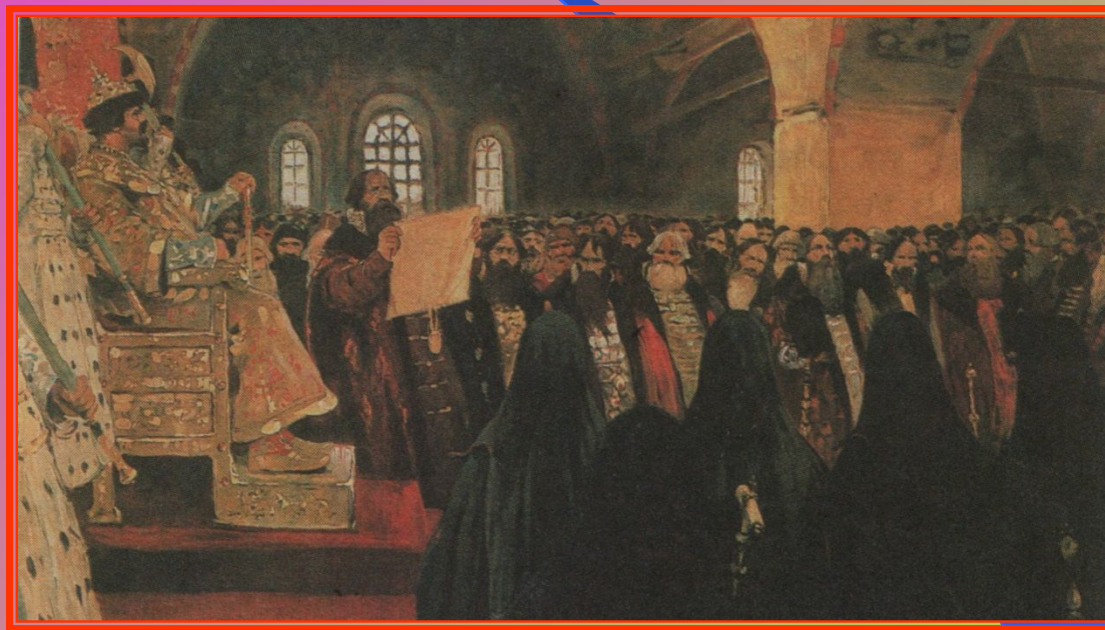
С.В. Иванов «Земский собор»