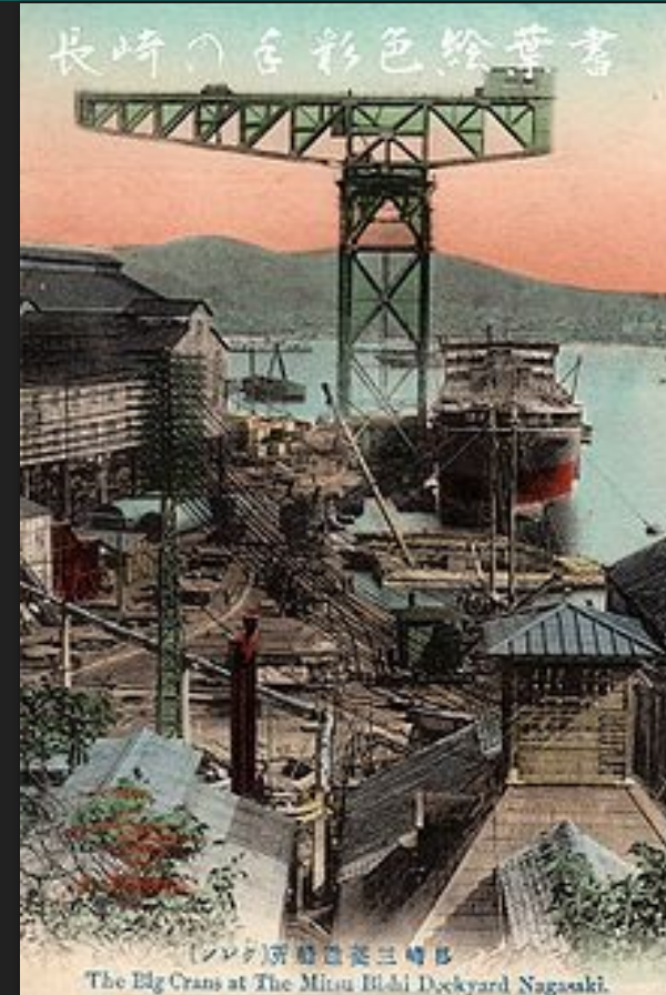
Большие подъемные краны на верфи Мицубиси в Нагасаки, период Мэйдзи

В целях осуществления агрессивной империалистической политики японская крупная буржуазия установила союз с самураями- так называлось японское дворянство и происходившая из его среды военщина.