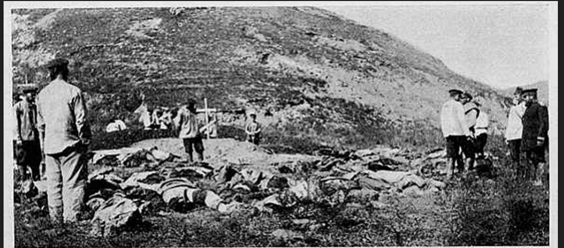
ПОРТЪ-АРТУРЪ. ЖЕРТВЫ БОЯ ПОДЪ ВЪСОКОЙ ГОРОЙ—БРАТСКАЯ МОГИЛА.

Русско-японская война была одной из первых империалистических войн за территориальный передел земли крупнейшими капиталистическими державами.