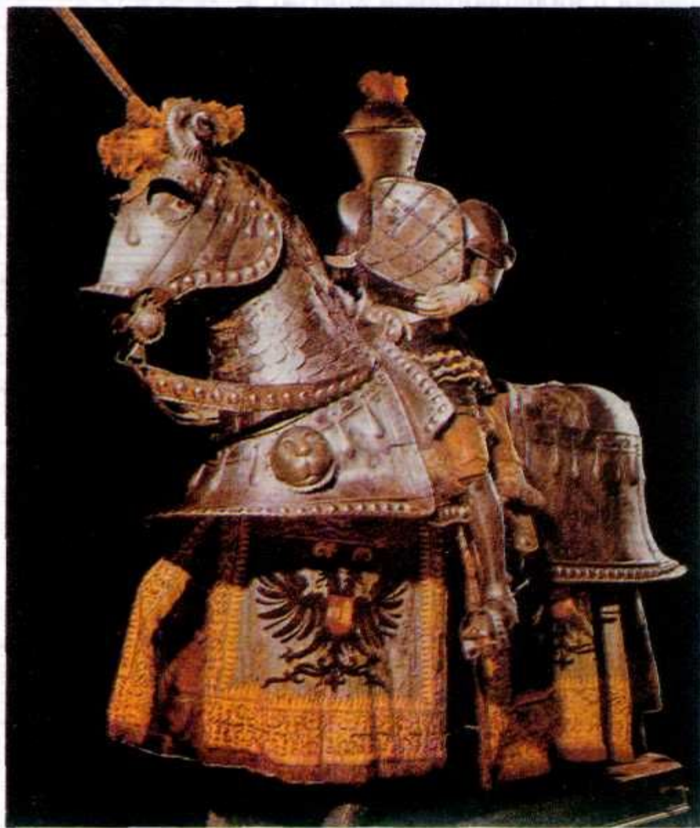
Доспехи Карла V.