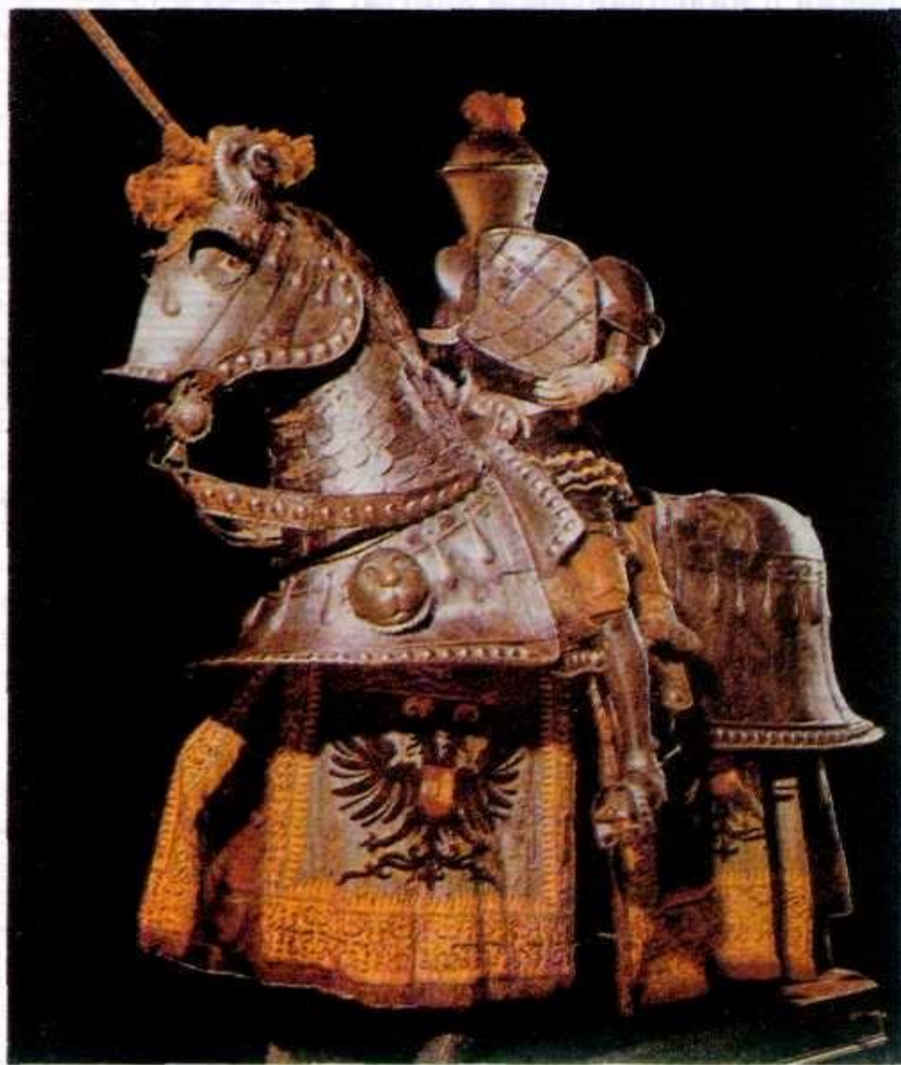
Доспехи Карла V.