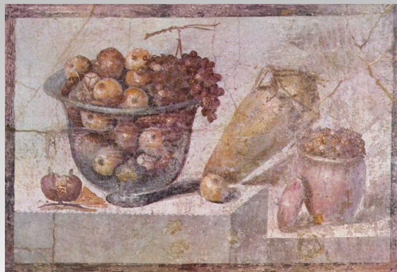
Фрукты ( античная фреска )

Будучи сильным и богатым государством, Карфаген не мог потерпеть соперников в Средиземноморье. Усиление Римской республики привело к открытому столкновению. Между Римом и Карфагеном начались войны, получившие название Пунических .