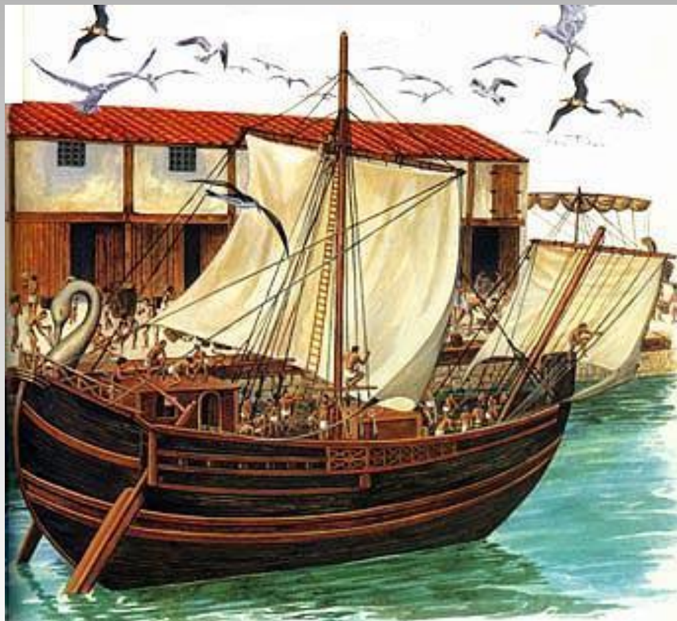
Карфагенский торговый корабль

В самом Карфагене выращивали пшеницу и ячмень, производили вино. Все остальные товары Карфаген ввозил из других государств и своих колоний. Из центральной Африки приходили караваны с золотом, слоновой костью, шкурами животных и рабами. Из Сардинии привозили хлеб, серебро, соль, из Испании – олово и железо; с берегов Балтийского моря – высоко ценившийся тогда янтарь.