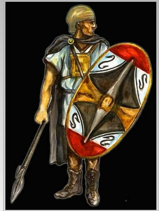
Карфагенский воин в полном вооружении