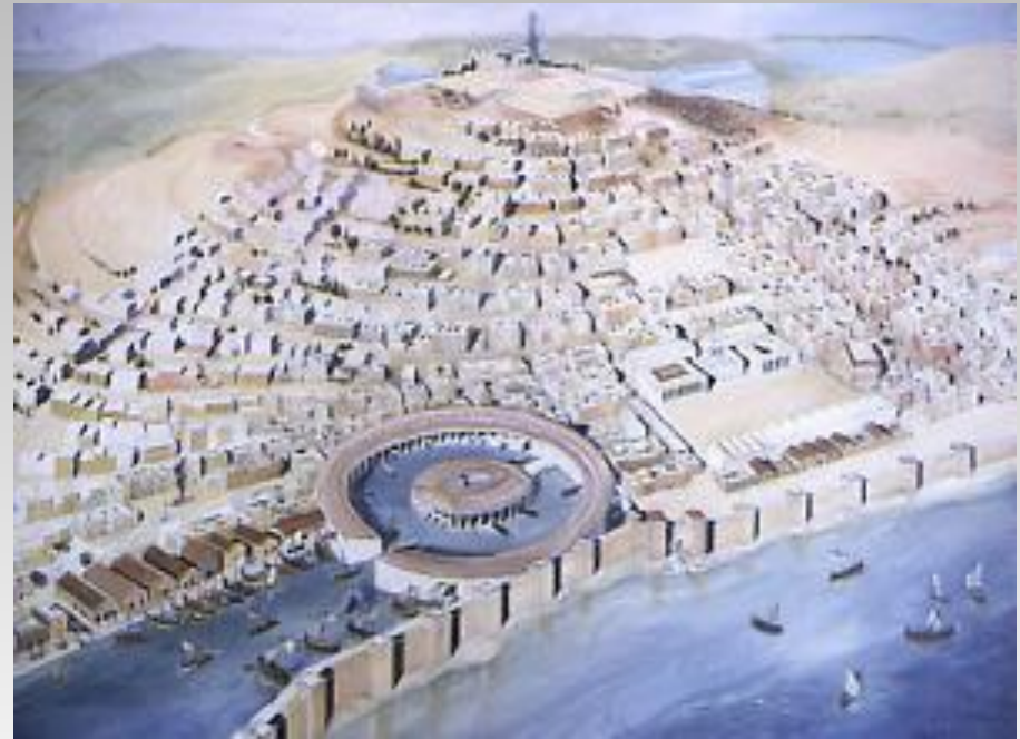
Панорама Карфагена (реконструкция)

Это был обширный круглый бассейн, окружённый огромным кольцеобразным зданием, колонны которого поднимались из воды. Вход в порт преграждали массивные цепи. Триеры проплывали между колоннами внутрь арсенала и по наклонной плоскости поднимались в сухие доки, рассчитанные на 220 кораблей.