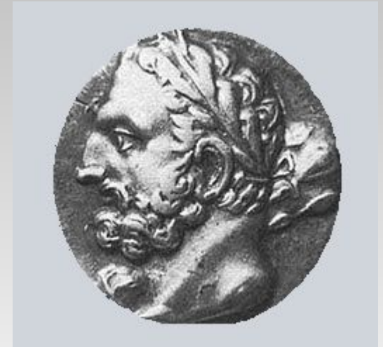
Гамилькар Барка. Изображение на карфагенской монете