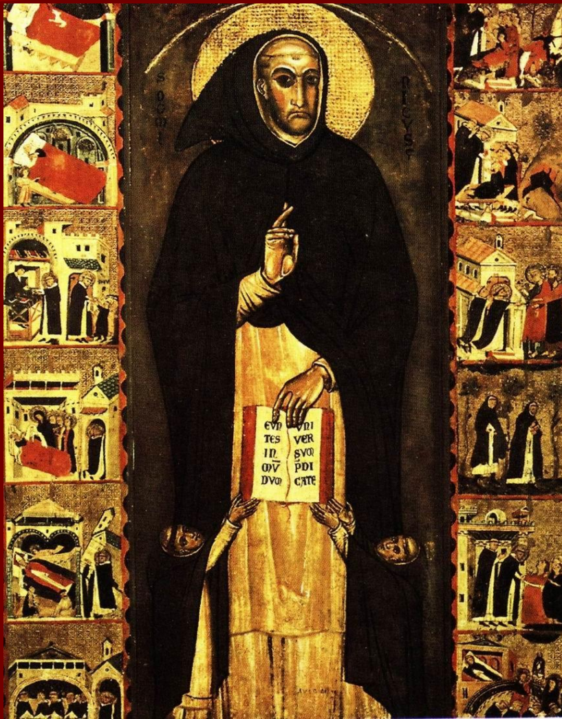
Франциск Ассизский. Фреска из монастыря Сакро Спеко в Субиако (Италия). 1228.