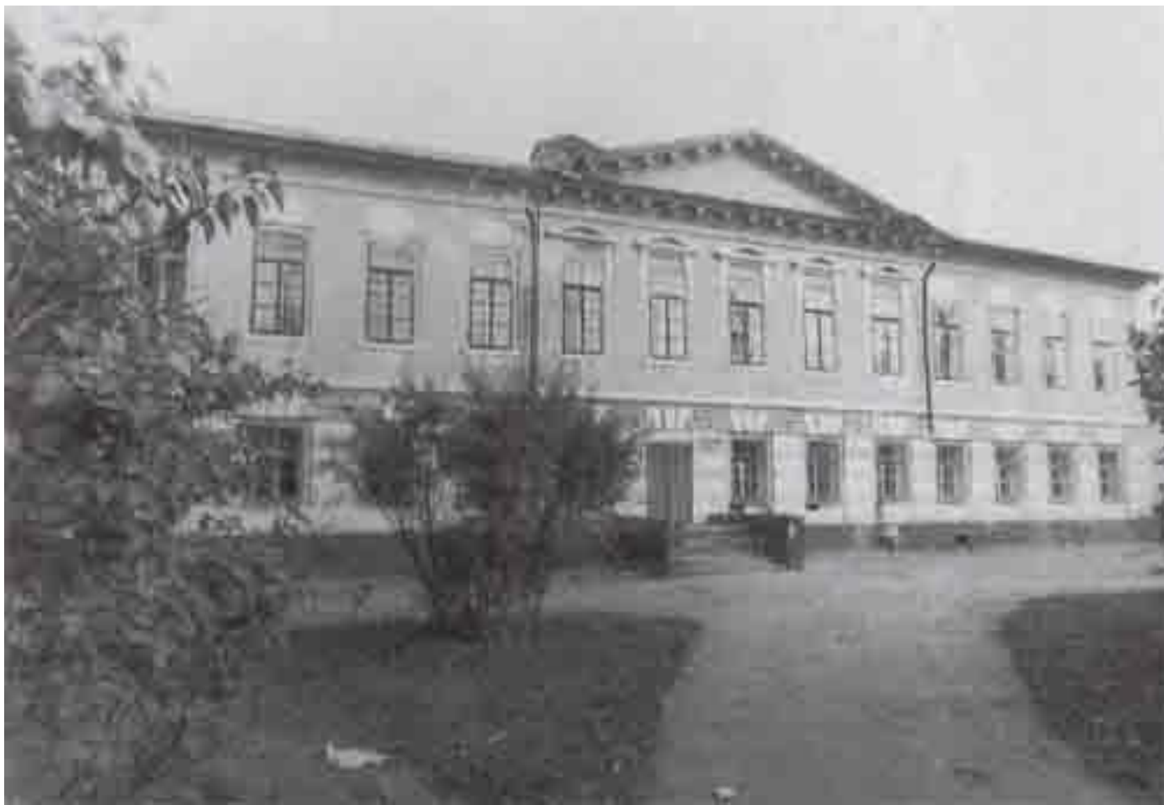
Усадебный дом в с. Молоди