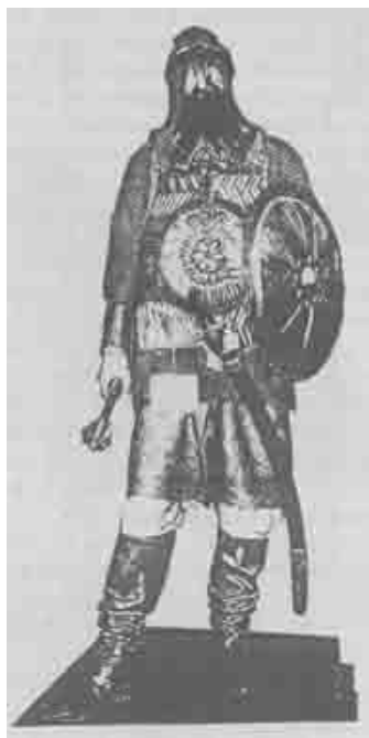
Вооружение русского пешего воина