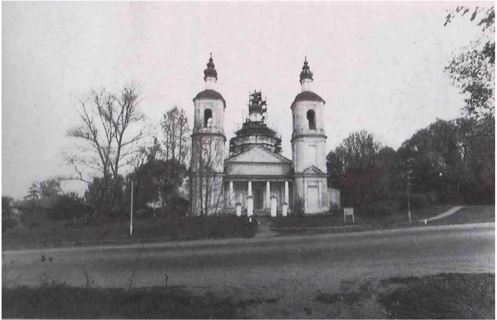
с. Молоди. Церковь Вознесения