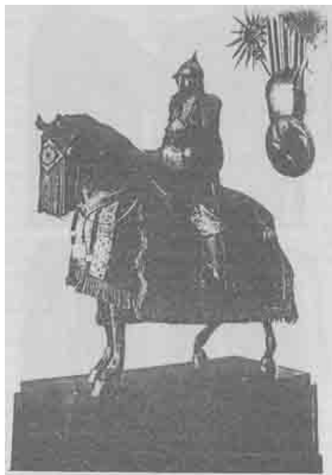
Вооружение русского конного воина