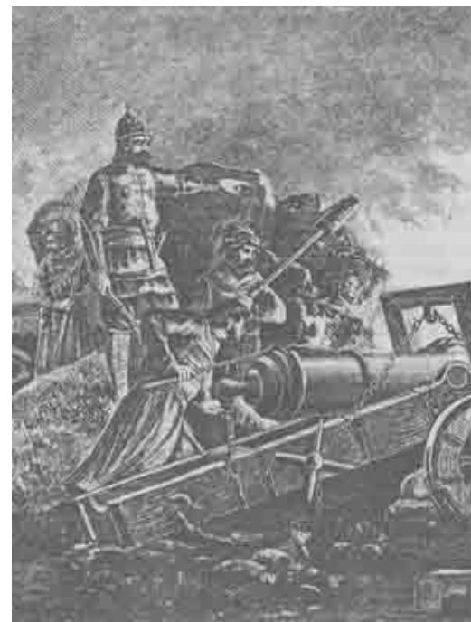
Московские пушкари XVI — XVII в.