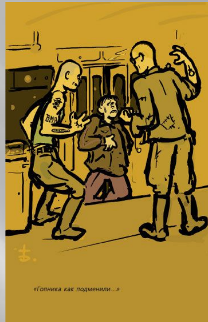
«Гопника как подменили...»

Стиль розмови гопів — українсько-російський суржик. Гопи зазвичай дуже обмежені і нецікаві особи, та це й не дивно, адже вони – наслідок ніяк не задовільного стану державної економіки і суспільно-ментальної ситуації.