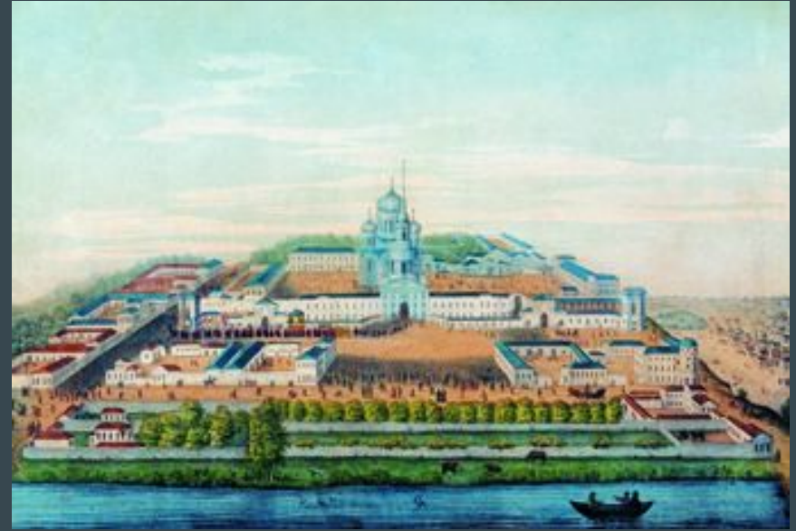
Крестный ход в день прославления святителя Тихона

В начале 19 века в монастыре осуществлялась перестройка строений. В 1845 году было начато строительство нового величественного пятикупольного восьмипрестольного трехэтажного собора в честь Владимирской иконы Божией Матери. При постройке этого храма и разборке старого в 1846 году были обретены нетленными мощи святителя Тихона. В 1861 году 13 августа состоялось его прославление.