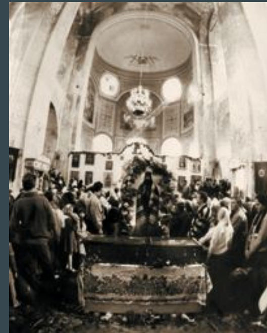
Возвращение святых мощей. 1991

В 2010 году Задонский Рождество-Богородицкий мужской монастырь отметил свой 400-летний юбилей