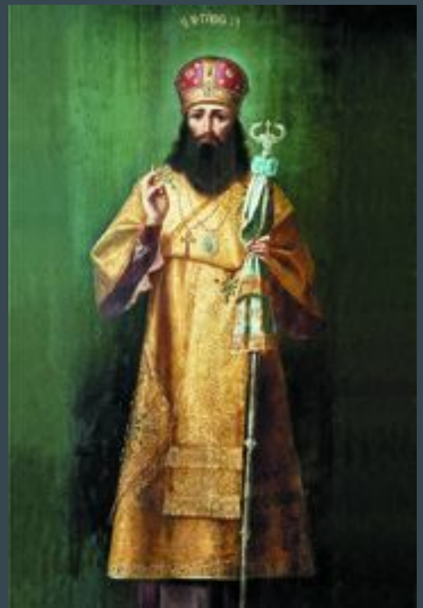
Святитель Тихон Задонский

Скромную задонскую обитель ждало новое прославление. В 1769 году сюда переселился на покой, оставив Воронежскую кафедру, святитель Тихон.