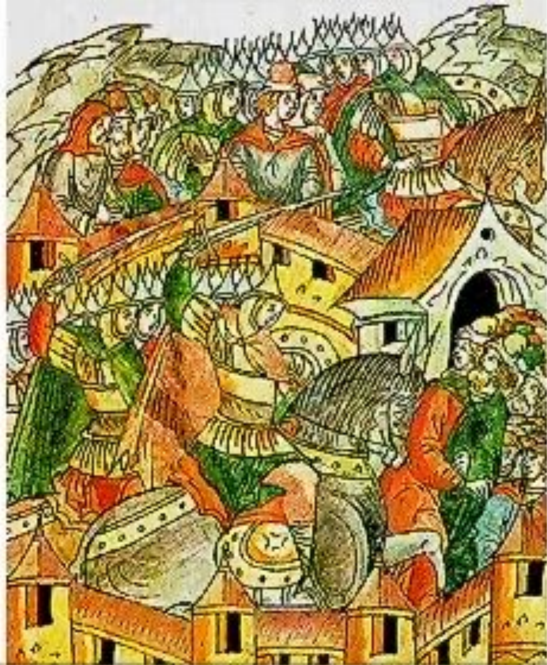
Взятие и разорение ордынцами Москвы 1238 г.