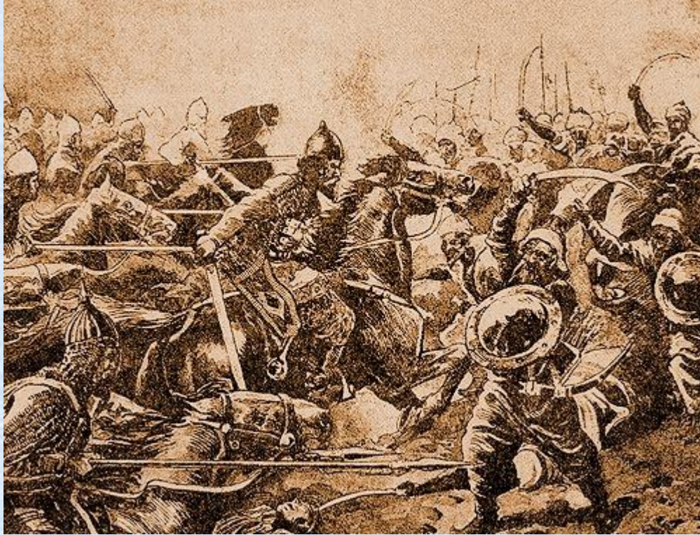
Битва Галицкого войска с монголами

«Русь спасла Европу от МОНГОЛЬСКОГО нашествия»