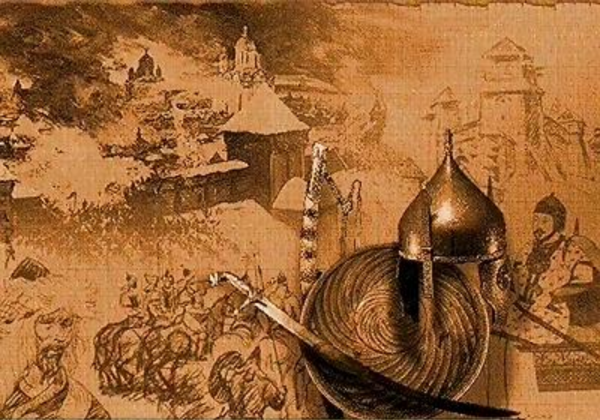
Татаро-монгольское нашествие на Русь 1237 г.