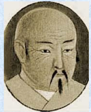
Хан Батый ( Бату- хан)