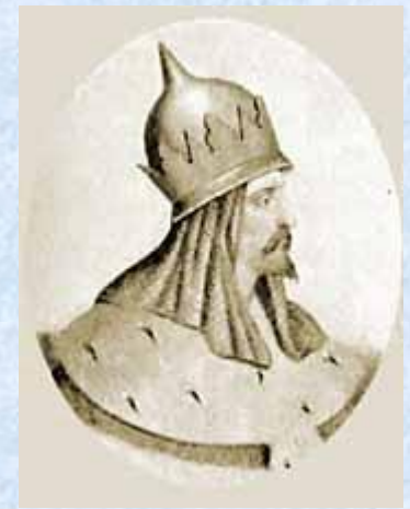
Мстислав Романович, погиб в битве на Калке

Южные русские князья откликнулись на просьбу половцев и приняли участие в 1223 г. в битве на р. Калке