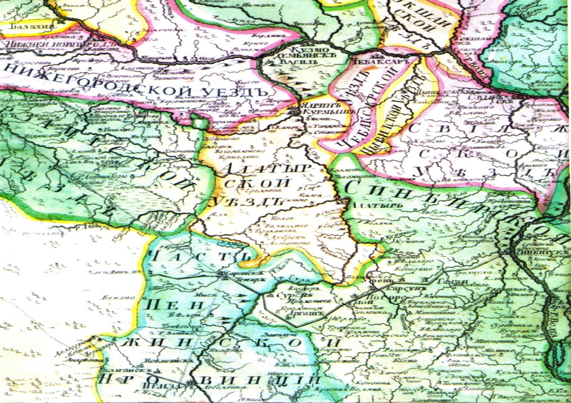
Административно-территориальное деление территории мордовского края на «Атласе Российском...» 1745 г.