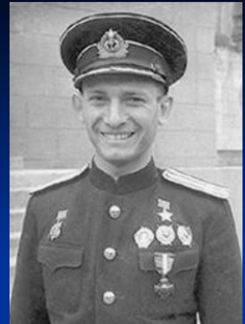
ФИСАНОВИЧ Израиль Ильич

Весной 1944 года капитана 2-го ранга И. И. Фисановича командировали в Великобританию , где англичане должны были передать Советскому Союзу в счёт репараций с Италией четыре английские подводные лодки типа В. Их нужно было изучить и переправить своим ходом на советскую военную базу. 25 июля 1944 года подводная лодка В-1 под советским военно-морским флагом вышла из Шотландского порта Лервик , но на пути в Полярный погибла. Долгое время причины её гибели оставались невыясненными. Только в послевоенные годы удалось установить, что в 9 часов 39 минут по Гринвичу 27 июля 1944 года лодку атаковал и потопил самолёт британской береговой охраны в 230 милях к северу от Шотландских островов в точке с координатами , 1.266667 1°16'00" в. д. 1.266667° в. д. ( G )