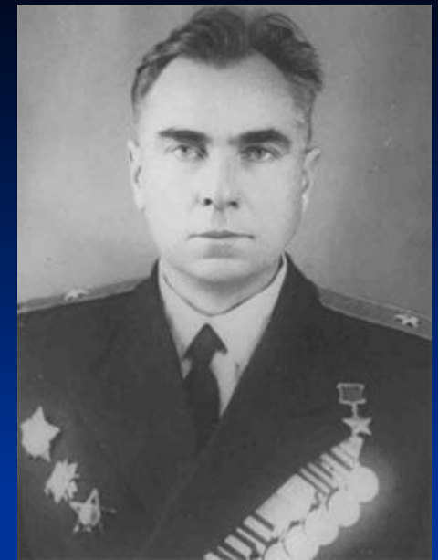
ЛУНИН Николай Александрович

В марте 1942 г. Н.А. Лунин был назначен командиром крейсерской подводной лодки К-21 Северного флота. Экипаж подводной лодки произвел 5 минных постановок у берегов противника, высадку диверсионной группы в тыл врага, выходил в Карское море на поиск фашистского рейдера "Адмирал Шеер". В апреле 1942 г. экипаж К-21 обнаружил и оказал помощь подводной лодке Щ-402", которая терпела бедствие. 5 июля 1943 г. К-21 под командованием капитана 2 ранга Н.А. Лунина, прикрывая конвой союзников, атаковала вражеский линкор "Тирпиц", который шел в охранении 12 боевых кораблей. После всплытия Н.А. Лунин донес командованию Северного флота о встрече с немецкой эскадрой и атаке "Тирпица". А неприятельский линкор, получив повреждения, вынужден был вместе со всей эскадрой скрываться в норвежских шхерах. Практически "Тирпиц" до конца войны был выведен из строя. С 1943 г. Н.А. Лунин командовал дивизионом подводных лодок Северного флота.