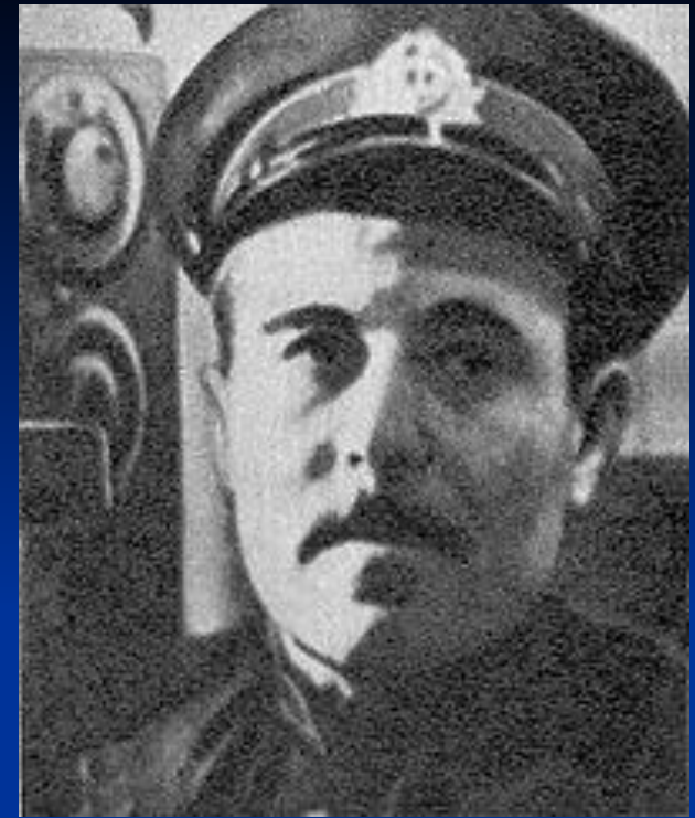
ГАДЖИЕВ Магомет Имадутинович

Великую Отечественную войну Гаджиев встретил на Северном флоте. 30 июля 1941 года ему было присвоено звание капитана 2 ранга. С начала войны Гаджиев участвовал в 12 боевых походах ПЛ дивизиона. На личном боевом счету Гаджиева к лету 1942 года числилось 10 потопленных транспортов противника. Он ввёл в практику подводников потопление транспортов противника из артиллерийских орудий, которыми была оснащены лодки типа К (2 орудия калибра 100 мм и 2 орудия по 45 мм). Кроме того, Гаджиев ввёл в традицию подводников и салют из орудия в знак того, что экипаж одержал очередную победу в море. « К-23 », на которой находился Гаджиев, была атакована вражеским самолётом и потоплена. Звание Героя Советского Союза было присвоено 23 октября 1942 года посмертно.