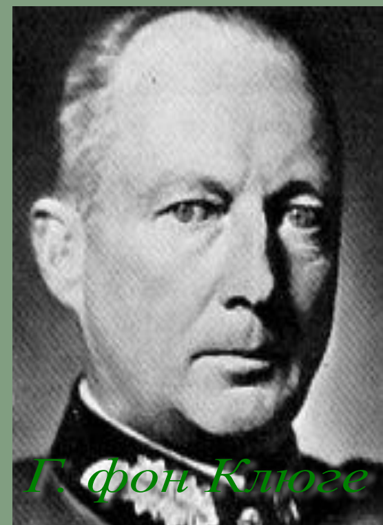
Г. фон Клюге