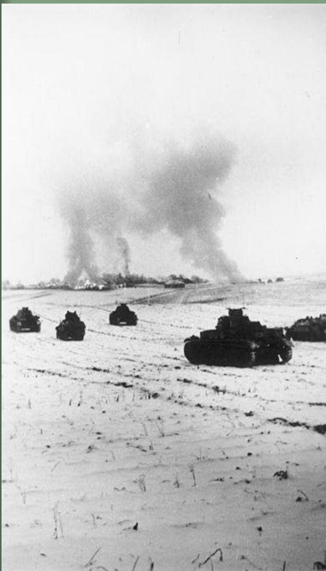
25. November 1941