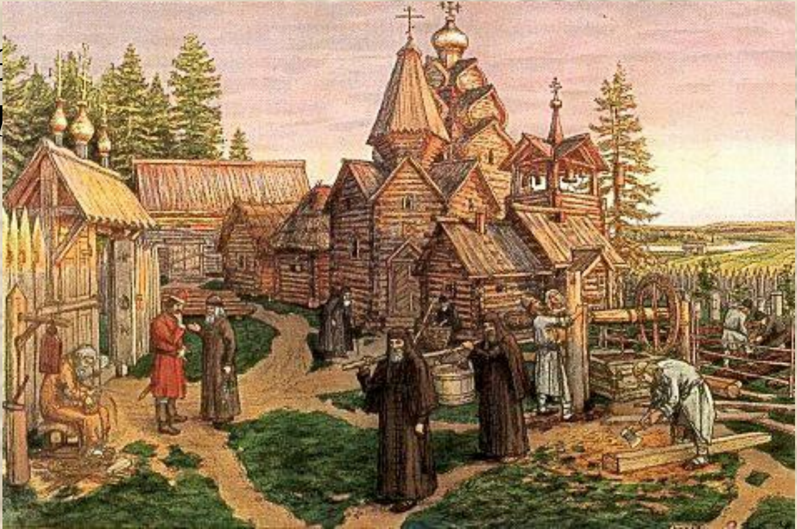
Даниловский монастырь. Князь Даниил Александрович