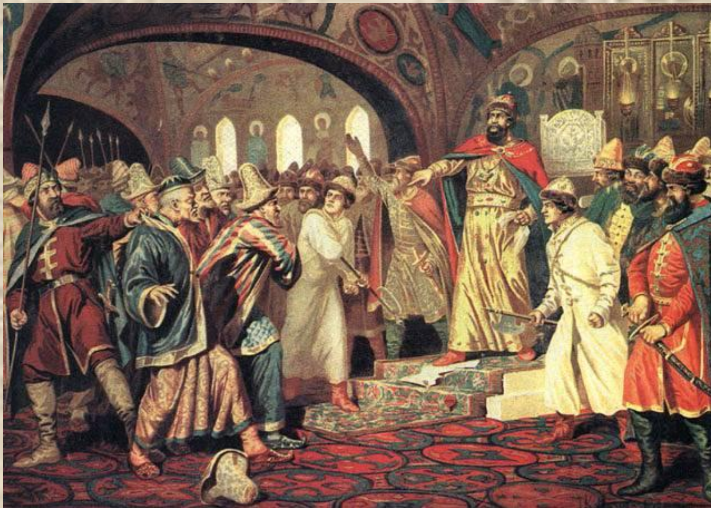
Иван III Васильевич