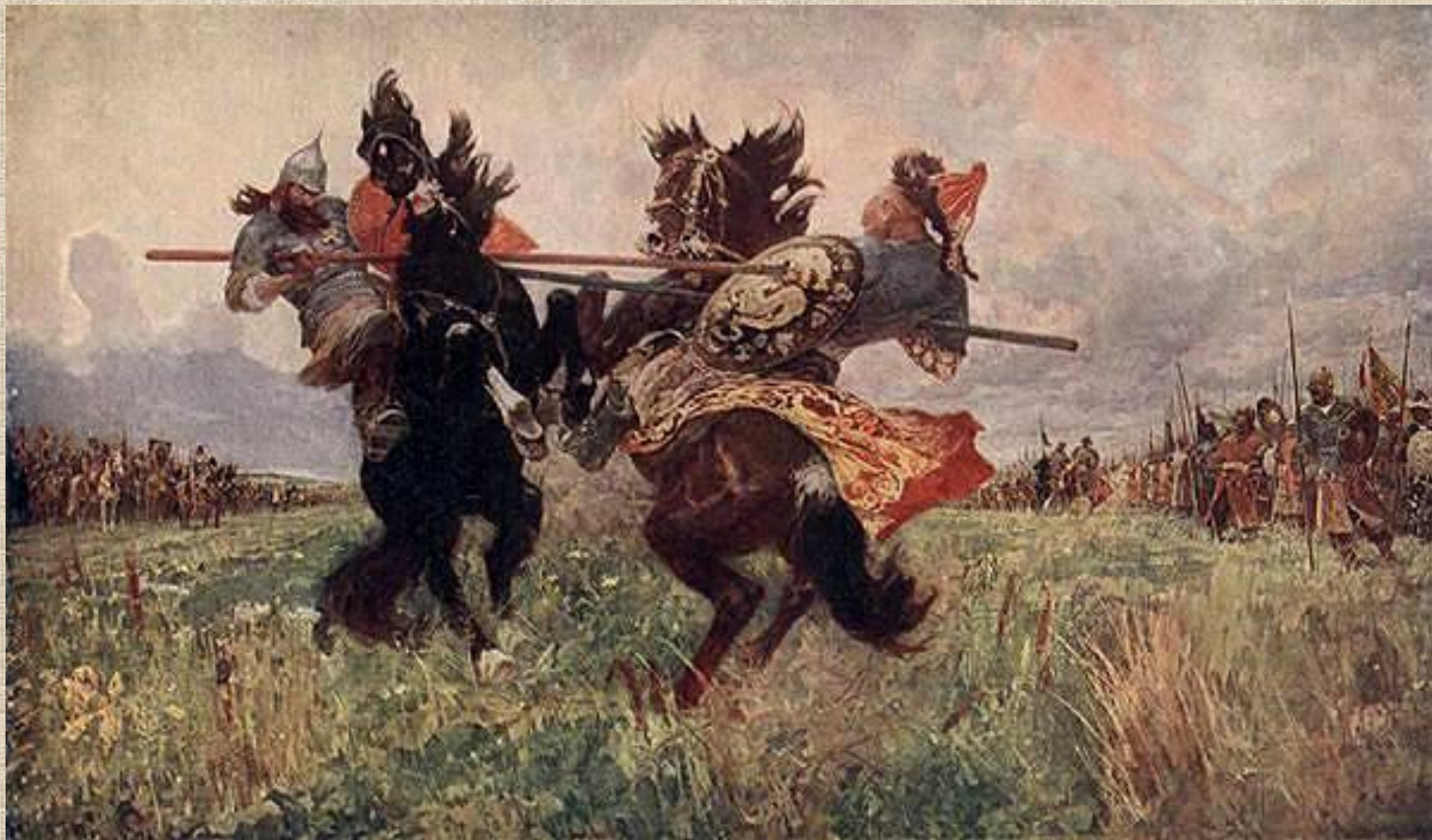
Поединок Пересвета с Челубеем Авилов В.