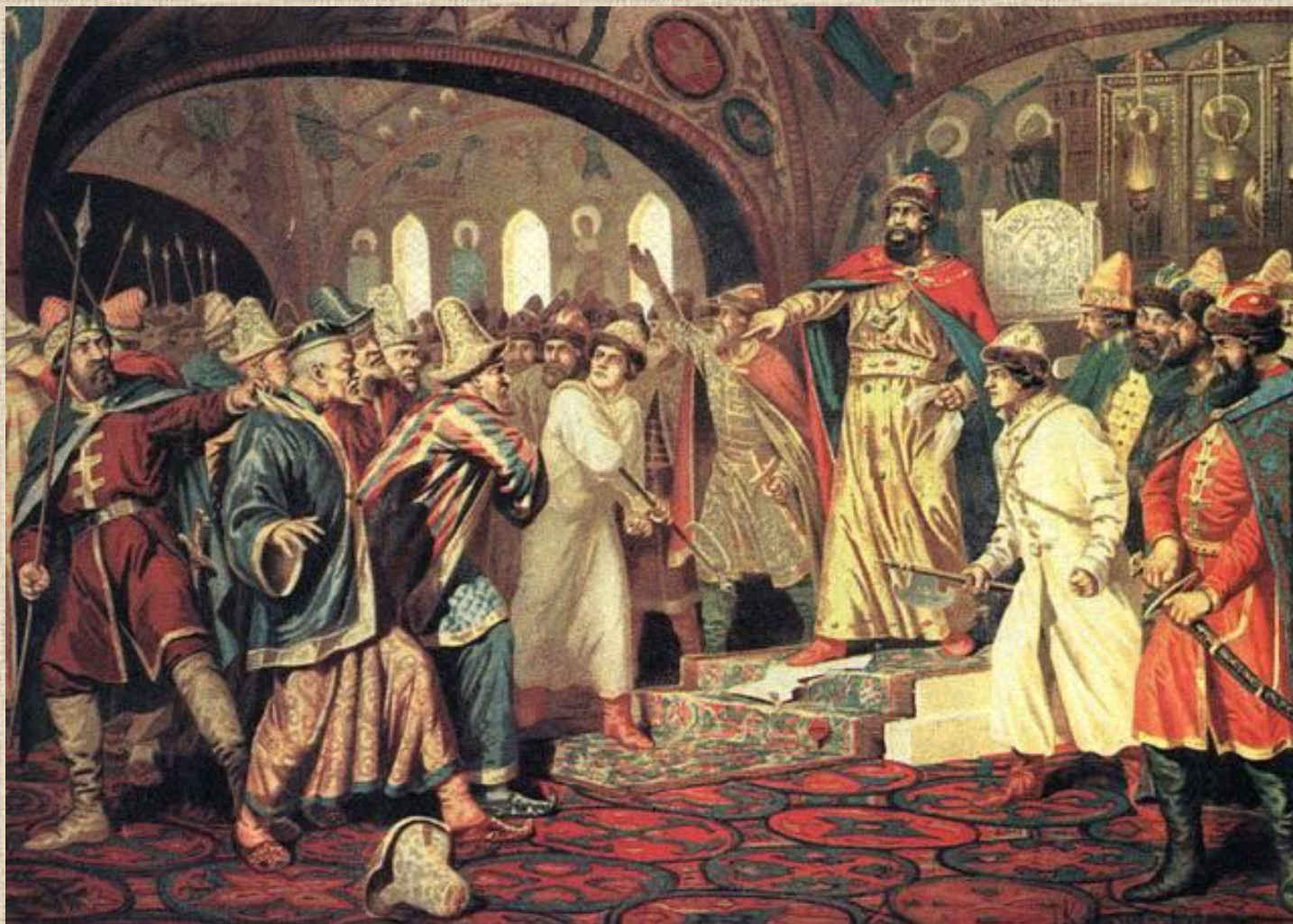
Иван III Васильевич