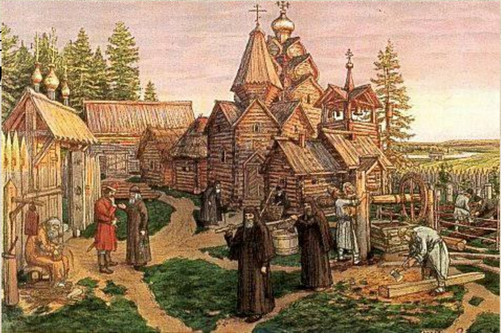
Даниловский монастырь. Князь Даниил Александрович