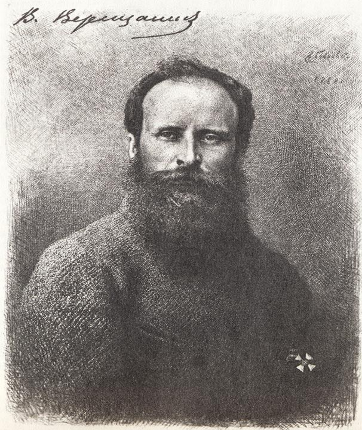
Василий Васильевич Верещагин