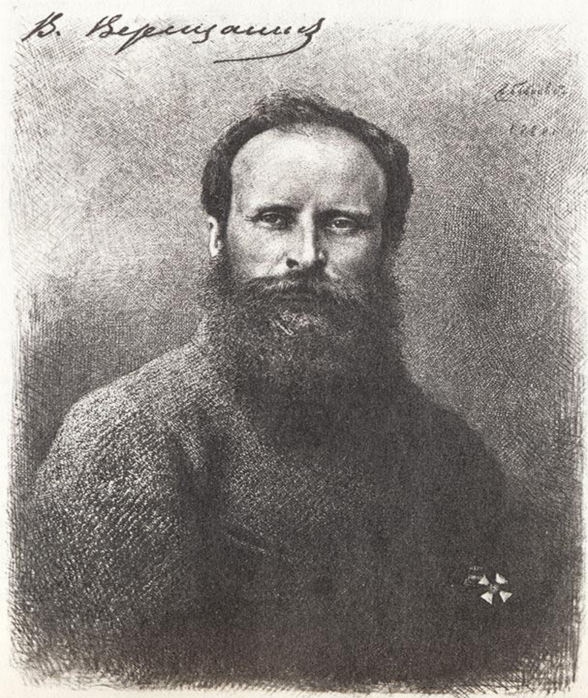
Василий Васильевич Верещагин