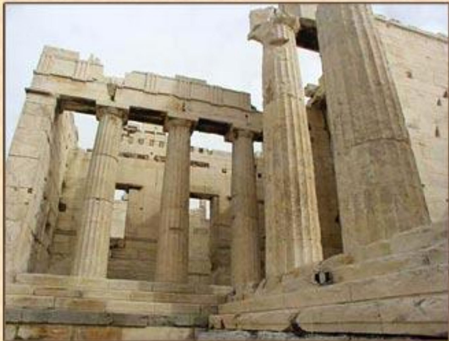
Пропилеи Афинского Акрополя