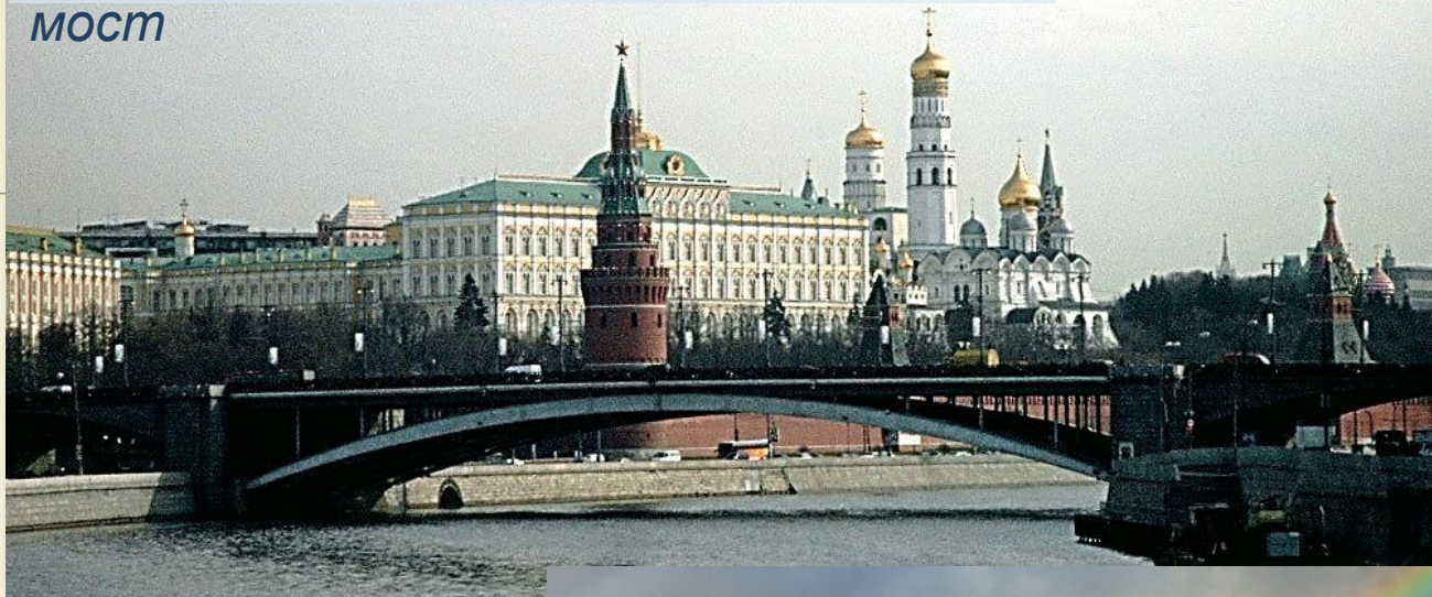
Вид на Кремль и Большой Каменный мост