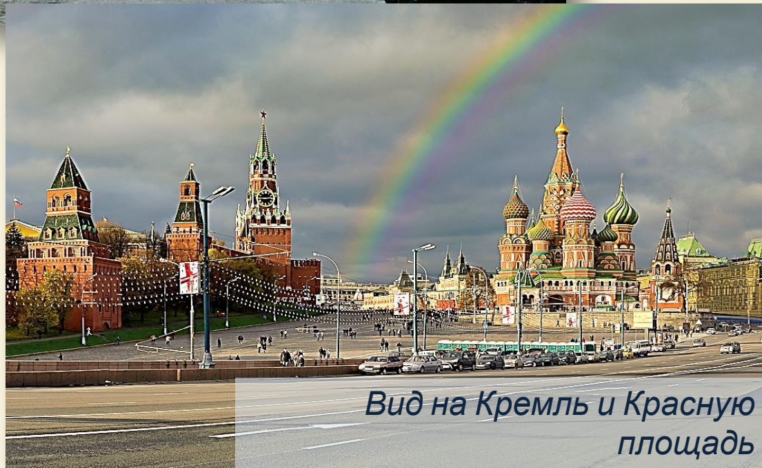
Вид на Кремль и Красную площадь с Москворецкого моста