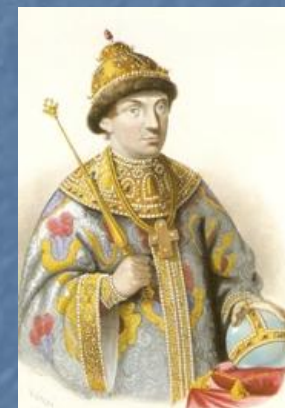
Фёдор Алексеевич Романов.