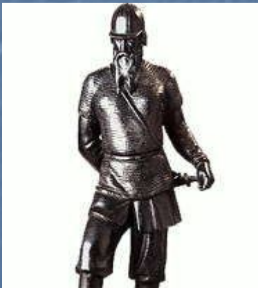
Ермак. Присоединение Сибири .