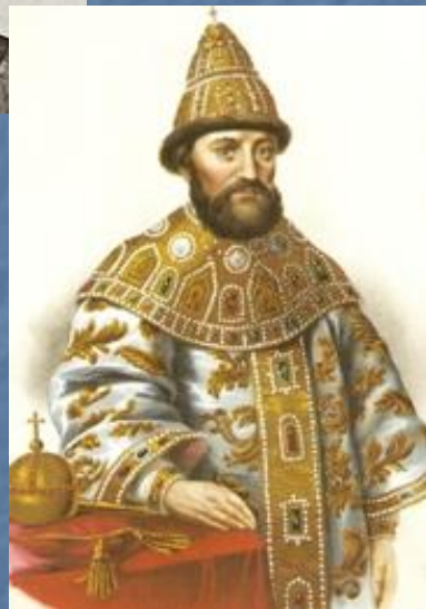
Михаил Фёдорович Романов.