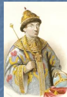
Фёдор Алексеевич Романов.