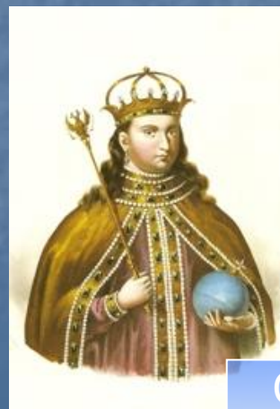
Софья Алексеевна Романова.