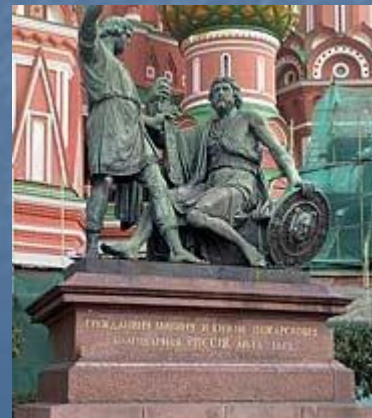
Минин и Пожарский, Освободившие Москву от поляков.