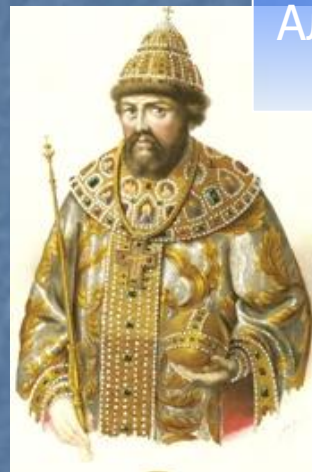
Алексей Михайлович Романов.