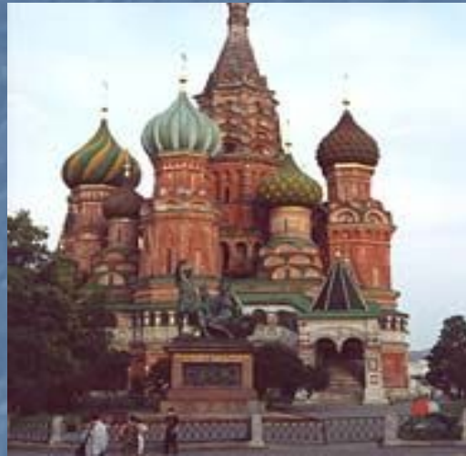
Покровский (Василия Блаженного).