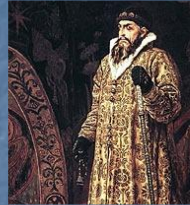
Иван IV(Грозный) Первый царь.