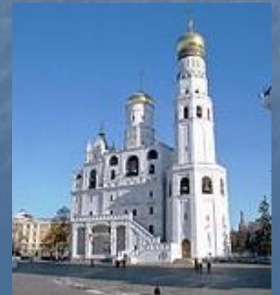
Колокольня Иван Великий.