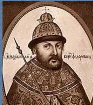
Б.Годунов - последний царь Московского государства