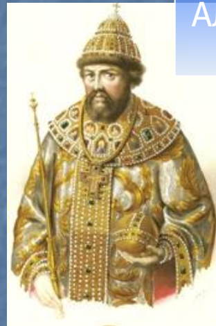
Алексей Михайлович Романов.