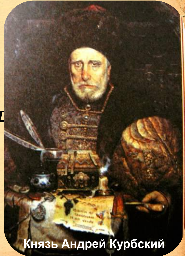
Князь Андрей Курбский