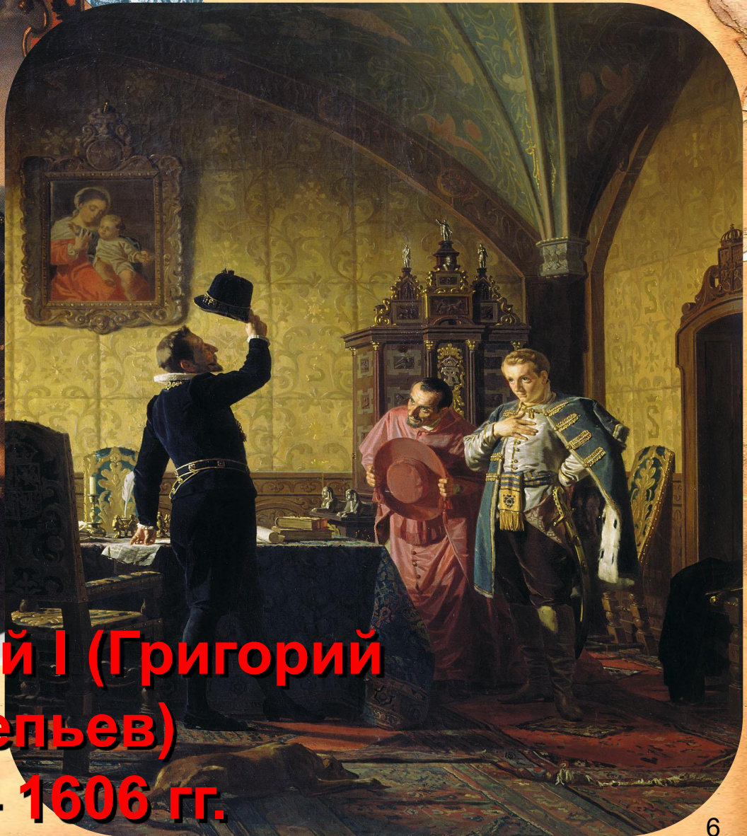
Лжедмитрий I (Григорий Отрепьев) 1605 – 1606 гг.