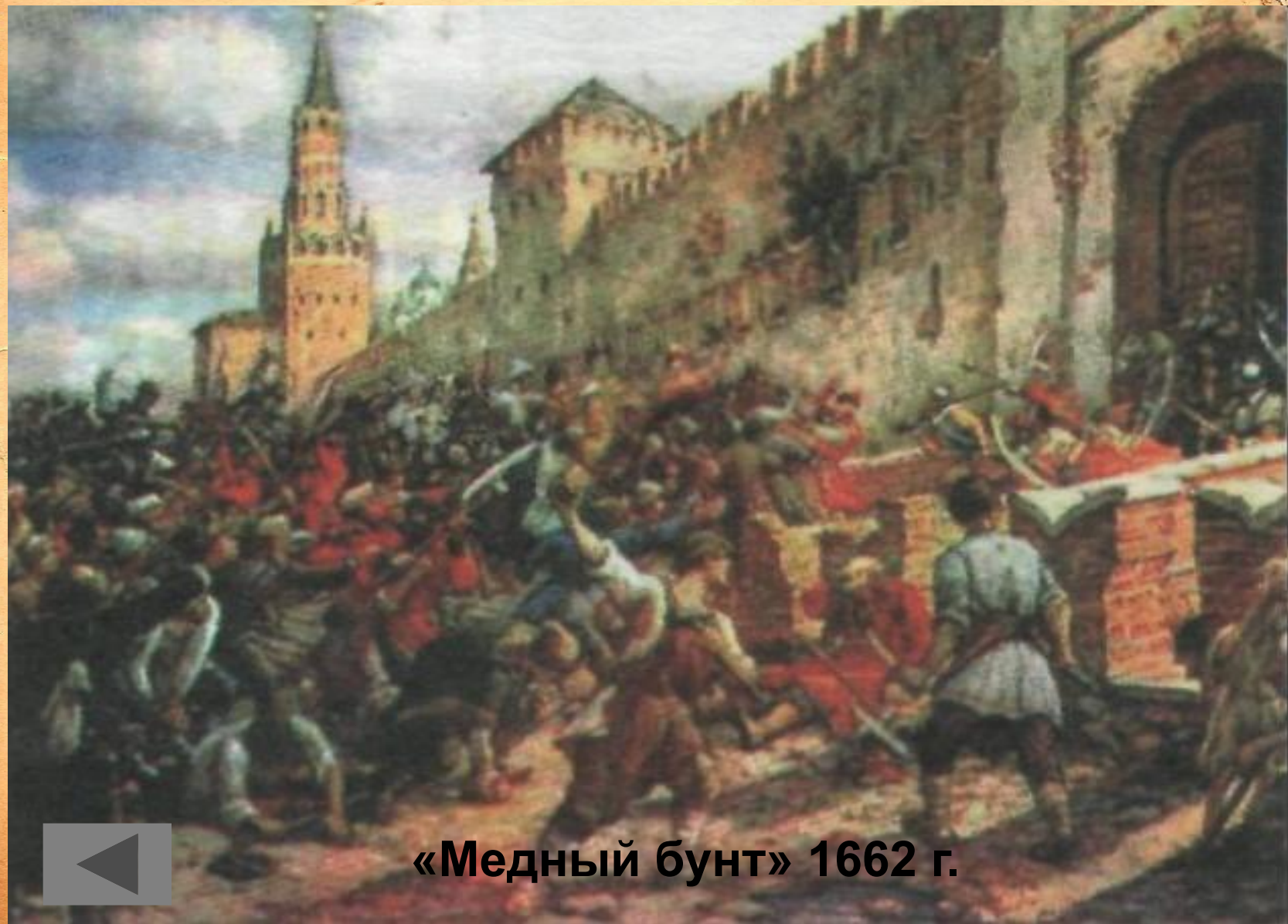
«Медный бунт» 1662 г.