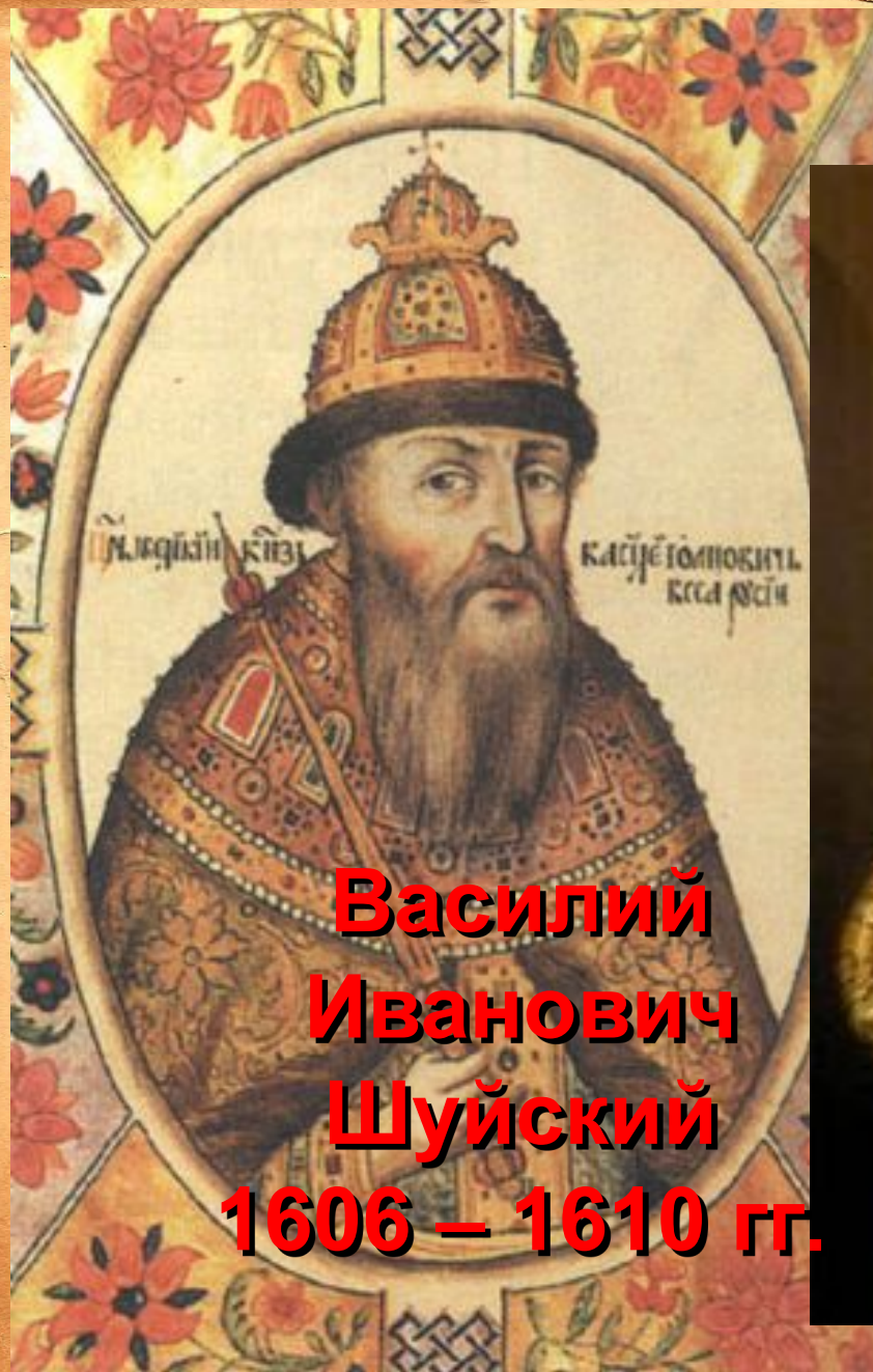
Василий Иванович Шуйский 1606 – 1610 гг.