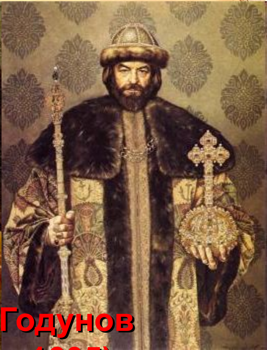
Борис Годунов (1598 – 1605)