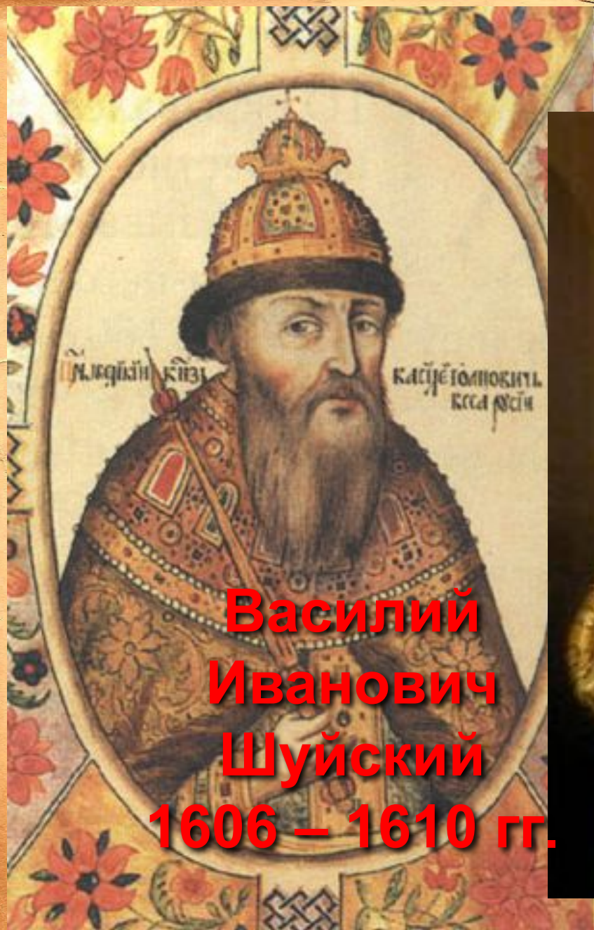
Василий Иванович Шуйский 1606 – 1610 гг.