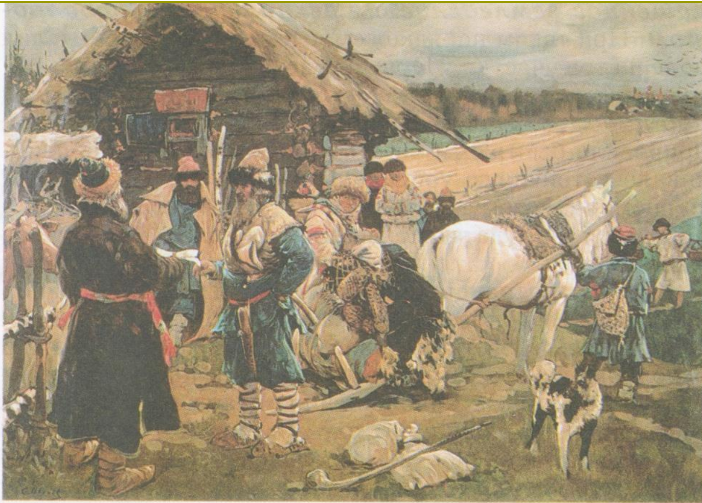
Юрьев день. Художник С. Иванов.