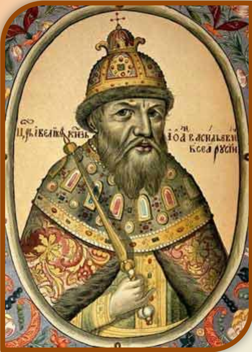
Иван III (1462-1505)