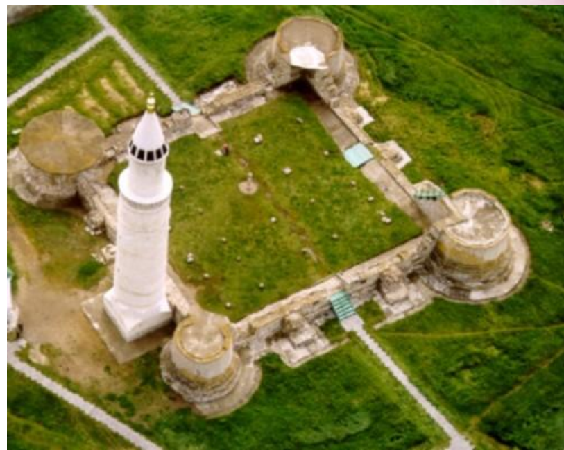
РУИНЫ ХАНСКОЙ МЕЧЕТИ В ГОРОДЕ БОЛГАР

Крепли старые города - Казань, Чаллы, Кирмень, Алабуга, Урмат на реке Казанке.