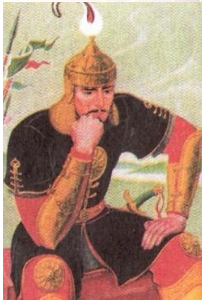
МАМАЙ МУРЗА Худ.Р.Шамсутдинов

Разорительные набеги предпринимают ушкуйники.