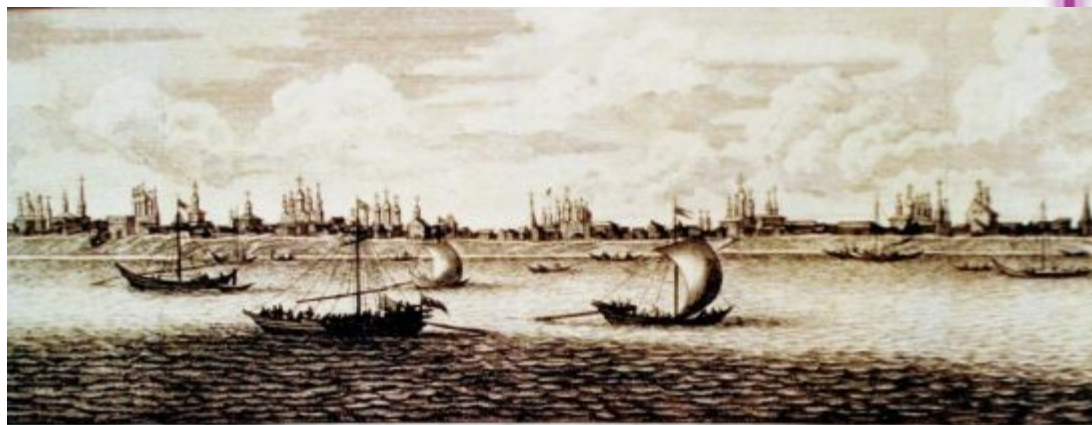
Aide-Approbée sur son Voyage en 1701-1708 de Corneille Le Bruin Amsterdam 1718 in f.