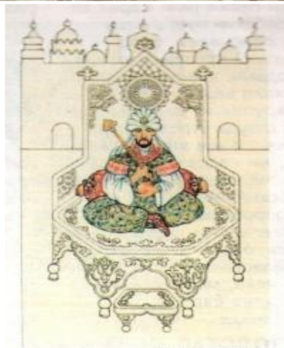
Джанибек-хан (1342—1357). Реконструкция по рисунку на Каталонском атласе, XIV в.

Неустойчивой стала власть ханов. Следующий после Узбека хан Джанибек правил 15 лет. Но он был убит в результате заговора. Такая же участь ждала жестокого Бердибека. Он занимал ханский престол всего два года. В Золотой Орде воцарилась смута. После убийства Бердибека на золотоордынском престоле за двадцать лет пребывало 25 ханов.