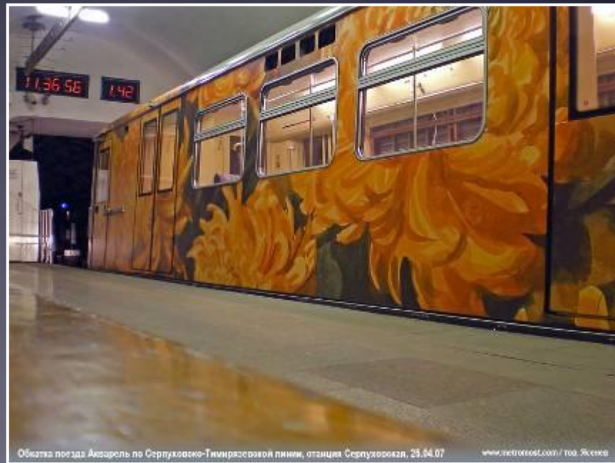
Обложка поезда Акварель по Серпуховско-Тимирязевской линии, станция Серпуховская, 25.04.07