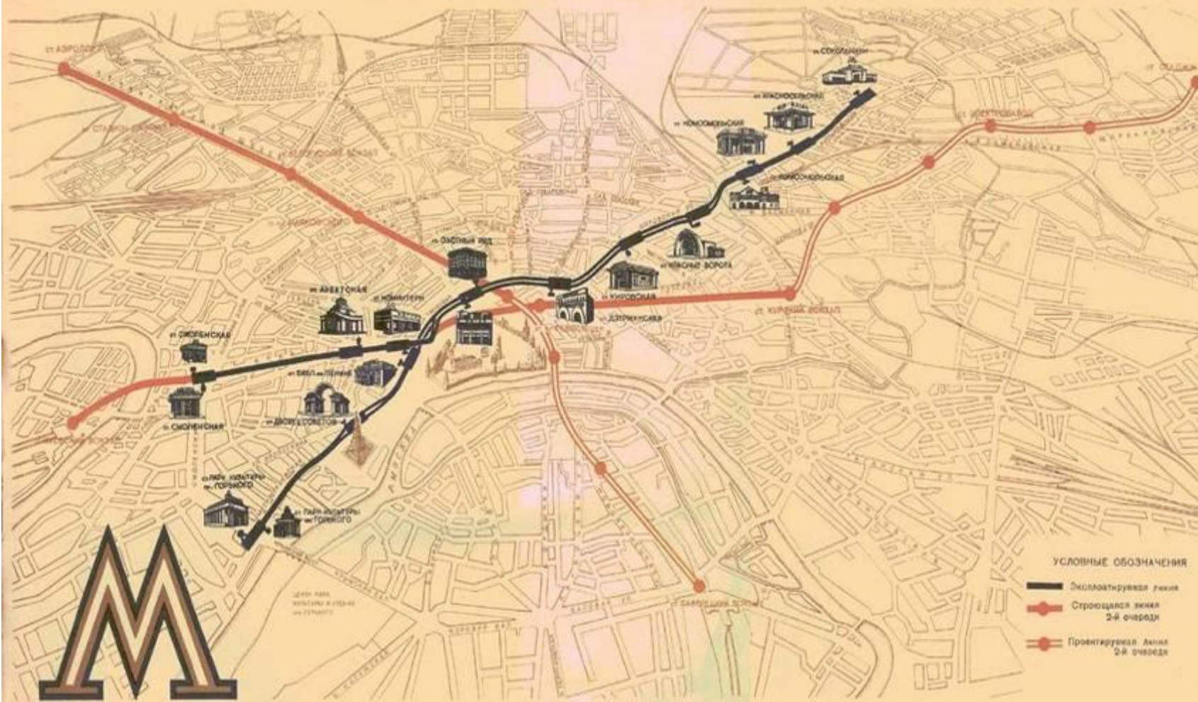
СХЕМА ЛИНИЙ МОСКОВСКОГО МЕТРОПОЛИТЕНА ИМЕНИ Л. М. НАГАНОВИЧА 1-й и 2-й ОЧЕРЕДЕЙ