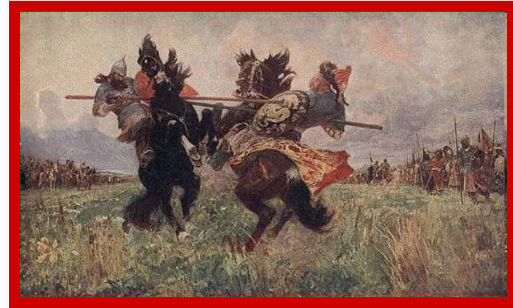
АВИЛОВ. ПОДИНОК ПЕРЕСВЕТА С ЧЕЛУБЕЕМ.