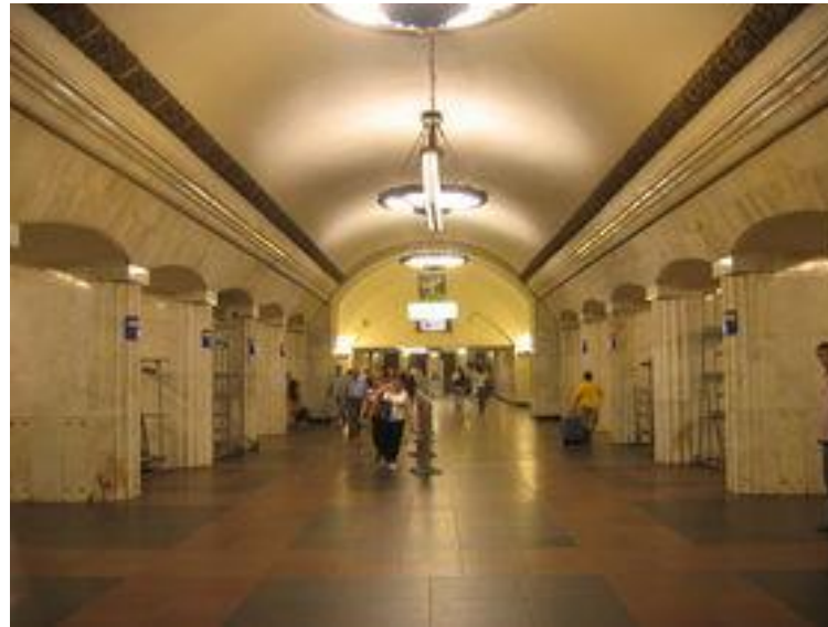
Станция метро "Курская"

1 января 1950-го года был открыт ряд станций метро «Курская» - «Парк Культуры».