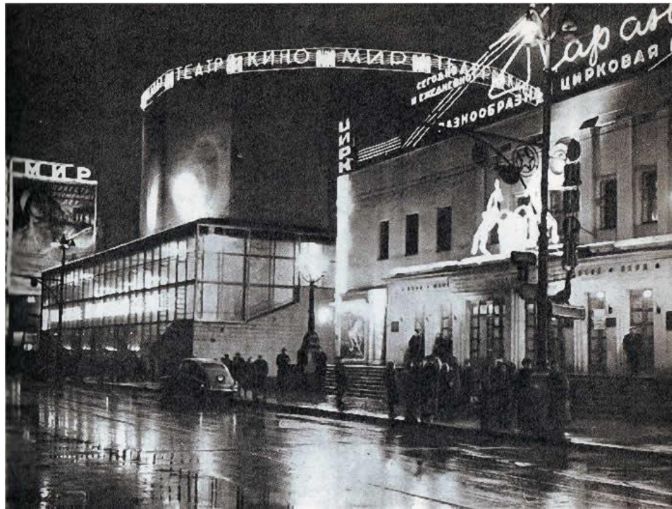
Кинотеатр "Мир" на Цветном бульваре

В 50-ых годах открылось много театров, кинотеатров, цирков. Они сразу стали популярными. Но из-за больших очередей не всем удавалось попасть на представление или показ фильма.