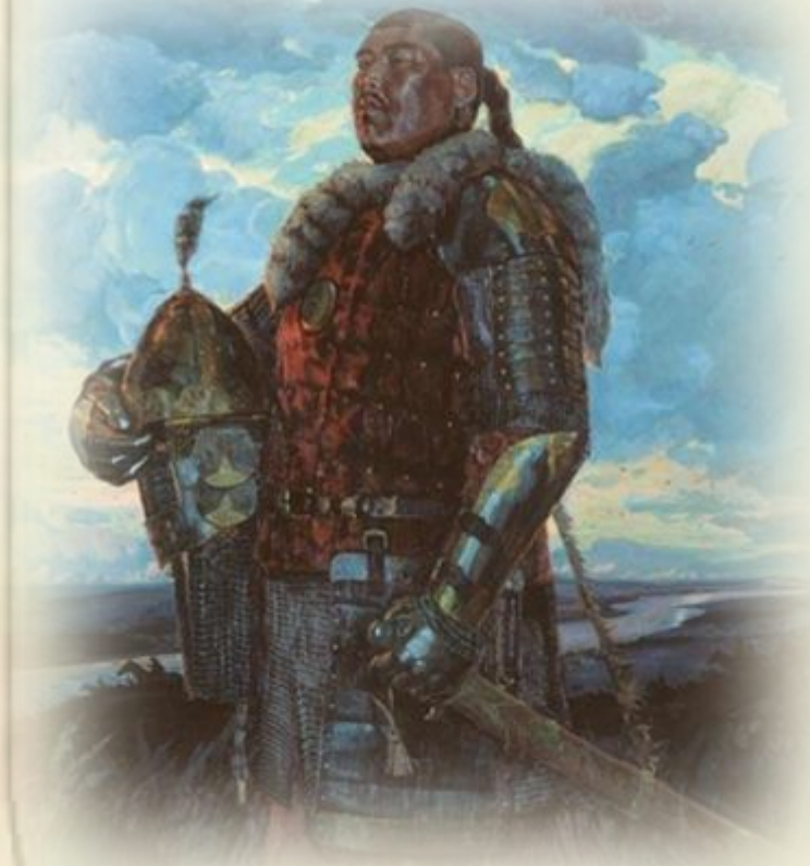
Пересвет и Челубей