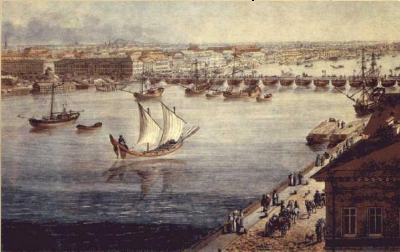
Наплавной Исаакиевский мост

Когда по Неве надо было пройти судам, часть лодок разводили в разные стороны. Зимой наплавные мосты разбирали. Первый наплавной мост назывался Исаакиевский. Он соединял Сенатскую площадь с Васильевским островом.