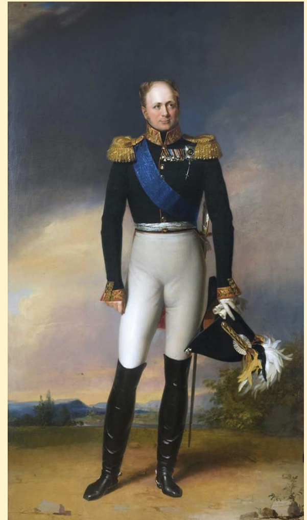
Джордж Доу. Портрет Александра 1

В 1813 году Александр I объявил всему псковскому дворянству благодарность за то, что приняли участие в отражении супостата. О патриотизме местных жителей говорит следующий факт: псковская губерния собрала пожертвование в 14352334 руб., не входя в те 16 губерний, где создавались боевые ополчения. Одного этого достаточно, чтобы показать, как русские люди отреагировали на бурные события 1812 года и какую посильную роль в этом сыграл город Торопец.